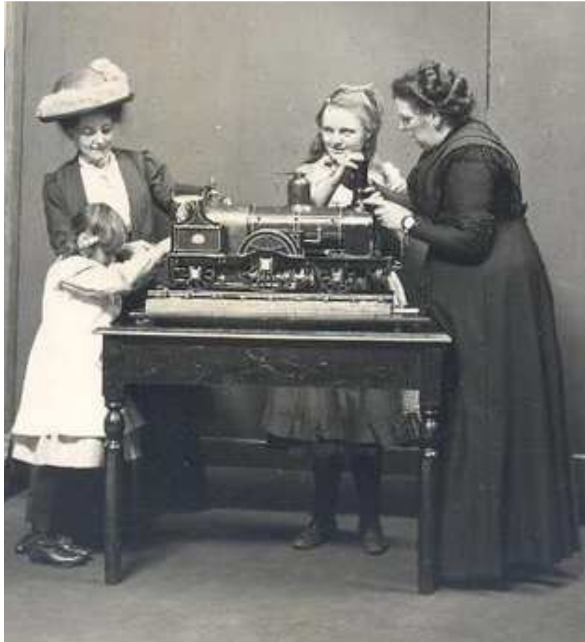
Fig. 2 : « Among the Engineering Models », in The Graphic , 26 juillet 1913, p.172. Image reproduite avec l'aimable permission de la Bibliothèque patrimoniale Valentin Haüy.