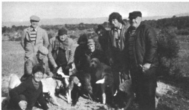
Photo 11. – Postiers et rabatteurs autour du « cochon » blessé.

fait, parmi d'autres, est significatif de la nature des enjeux symboliques que recouvrent l'usage et la maîtrise de l'espace sauvage. Notons, en outre – et ce phénomène est tout aussi significatif – que c'est face aux problèmes de maîtrise de la colline que les communautés rurales ont, par le biais des sociétés de chasse, défini explicitement les divers degrés d'étrangeté.