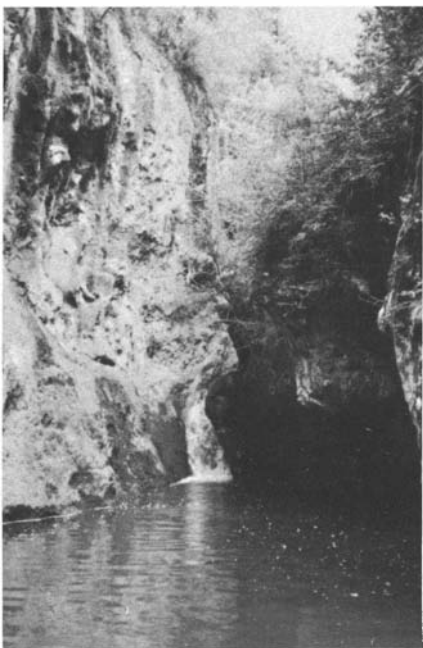
Photos 13 et 14. – Le site de Saint-Barthélémy (à Salernes). La source, le bois, la chapelle.

L'eau... Plus de la moitié des chapelles sont à proximité de ruisseaux ou de sources (photos 13 et 14). La légende attribue souvent au saint tutélaire le jaillissement de celles-ci, au sein de « sauvage solitudes » : la source de la Sainte Baume est, selon la tradition, née des larmes de Marie-Madeleine; celle de Cotignac est due, selon la légende, aux bienfaits de St Joseph ayant pris en pitié un malheureux berger, Gaspard, terrassé par la soif sur les pentes arides du Bessillon.