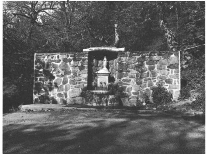
Photos 18 et 19. – Chapelles limitrophes... A la frontière de Cuers et de Solliès, en plein bois, se dressent deux chapelles Sainte Christine, bâties à 50 cm l'une de l'autre.