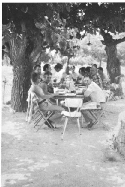
Photos 20 et 21. – « Ribotes » : de nos jours à Cotignac, vers 1930 à Salernes.

réunissaient chacune dans un cabanon une bande d'une dizaine de « collègues » appartenant à la même classe d'âge. On « faisait riboto » à l'occasion de carnaval : c'est au cabanon que l'on se retrouvait pour festoyer, dormir et préparer les déguisements ; au Beausset, des jeunes gens partaient aussi faire « bombance » pendant deux ou trois jours lors des fêtes de Noël. Plus généralement, c'est dans l'espace éloigné du cabanon que l'on conviait ses amis pour enterrer sa vie de garçon, que l'on faisait ripaille à l'occasion du départ d'une classe de conscrits ou pour inaugurer une saison de chasse.