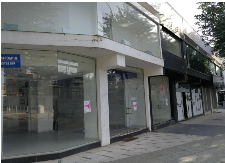
Photographie 3 - Le centre-ville moderne fortement touché par la crise économique de 2013 et par la relocalisation attractive des activités dans la vieille ville (Avenue Makarios, Nicosie, Carmenos, 2017)