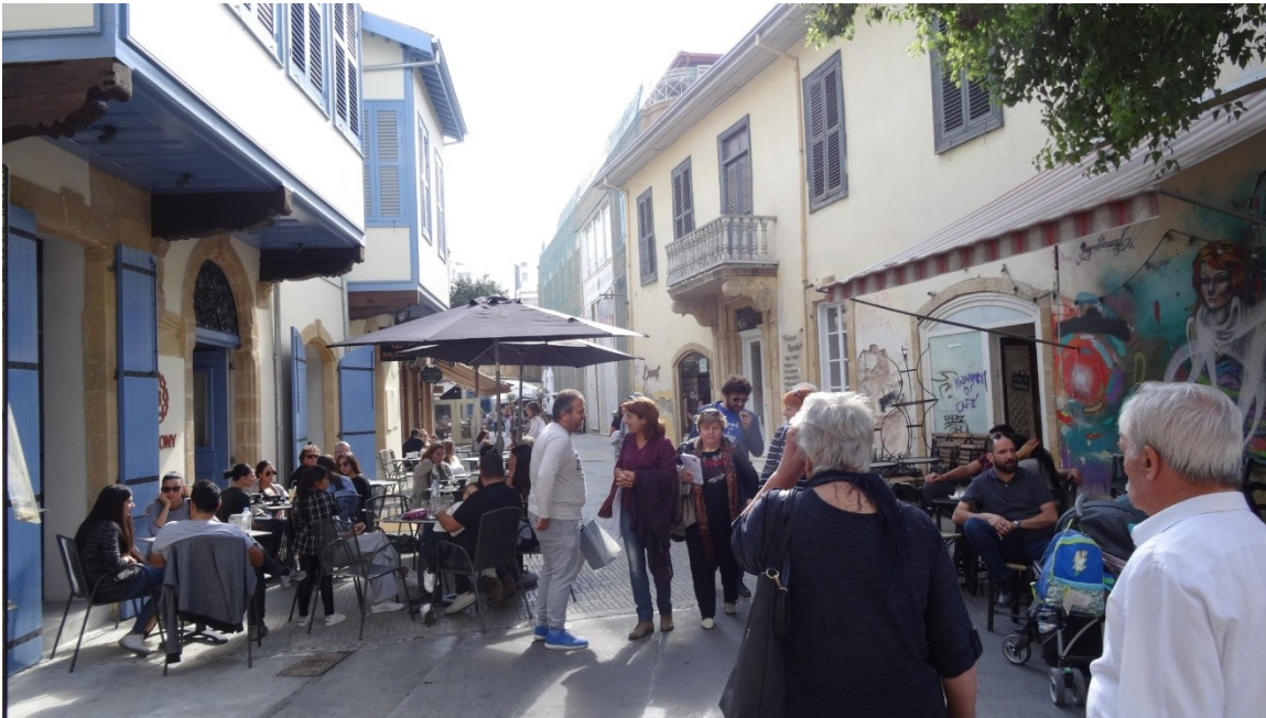
Photographie 9- Un énième nouveau café du quartier Ledras/Onasagorou (Balcony AllDay, rue Faneromeris, Nicosie sud, Sabrié, 2017)

La lente reconquête et la gentrification en marche de la vieille ville Depuis 2008 et l'ouverture d'un poste-frontière dans la rue Ledras/Lokmaci, la principale rue de la vieille ville, certaines activités ont commencé à recoloniser le centre-ville, quand bien même ce dernier est toujours amputé de 10 % de sa superficie en raison de la ligne verte (Constantinou & Papadakis, 2001). Aujourd'hui, les rues qui longent la ligne verte sont notamment envahies en soirée par les jeunes générations, qui n'ont pas vécu la partition de 1974, qui viennent boire un café ou un verre entre amis. Les bars ont fleuri dans la partie septentrionale de Nicosie Sud et de nouveaux cafés sont régulièrement ouverts (Photographie 9). La rue Ledras est entièrement aménagée et le développement des commerces et des restaurants se fait en tâche