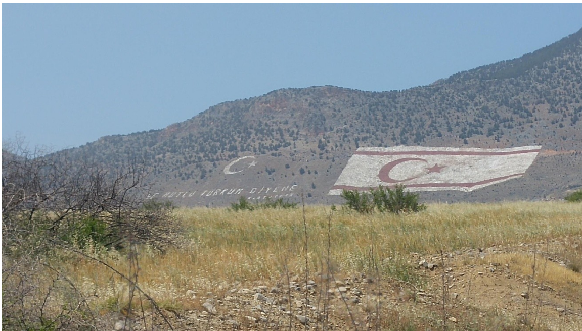
Photographie 1- Le drapeau chypriote turc de la chaîne de Kyrenia (Sabrié, mai 2016)

En 1974, la vieille ville de Nicosie, nord comme sud, a été touchée par de violents combats dont les impacts de balle sont toujours visibles et la population urbaine qui y vivait a d'abord fui les lieux. La ville, au sud de la ligne de démarcation, s'est rapidement dépeuplée. Ses habitants hellénophones se sont réfugiés chez leurs familles, dans le massif du Troodos ou dans d'autres villes telles Limassol ou Larnaca (Carte 1). Certains sont partis à l'étranger, notamment au Royaume-Uni. Plusieurs mois plus tard, par crainte que le danger perdure à proximité de la ligne de front, une partie d'entre eux est progressivement revenue s'installer au sud 15 des remparts vénitiens de la vieille ville (Carte 2). De nombreux ruraux, qui avaient fui leurs habitations dans le Nord, les ont rejoints (Sanguin, 2005).