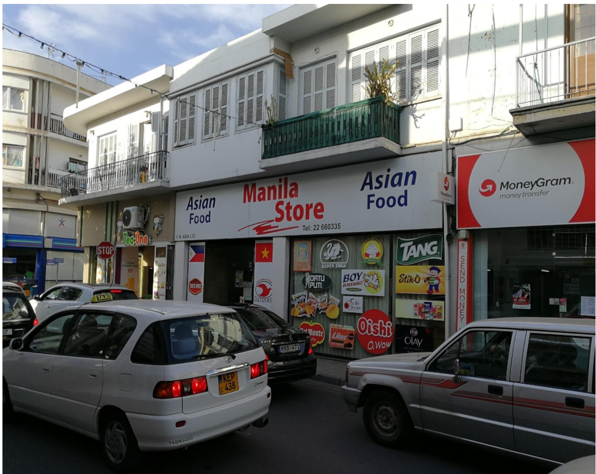
Photographie 6- Magasin, salon de thé et agence de transfert d'argent international à destination de la communauté immigrée, notamment asiatique (philippine et sri lankaise) (Rue Rigenis, Nicosie sud, Carmenos, 2017)

Avec le temps, le délabrement des infrastructures n'a pas favorisé l'envie des Chypriotes de retourner dans la vieille ville. Les populations immigrées, souvent payées en dessous du salaire mensuel minimum (de 870 € à Chypre selon la révision de 2012, soit 4,55 € par heure pour un employé de maison) et donc contraintes par le prix des loyers, sont restées dans ces quartiers, peu attractifs mais peu chers.