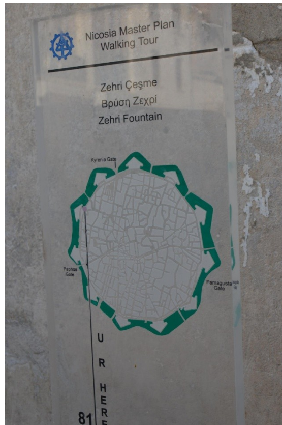
Photographie 2. Plan de Nicosie unifiée sans mention de la frontière actuelle, dessinée et affichée dans le cadre du Nicosia Master Plan (Nicosie Nord, Sabrié, septembre 2015)