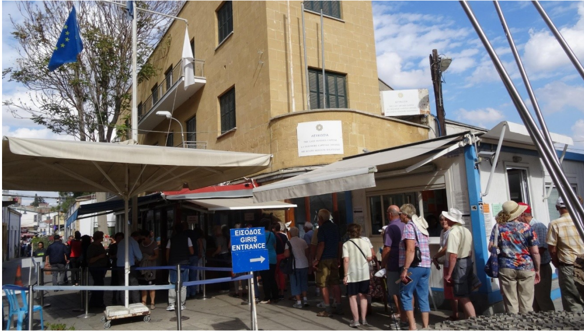
Photographie 10- Le poste frontière de la rue Ledras, côté chypriote grec (Nicosie, Sabrié, 2017)

usages de la frontière, dont les formes de tourisme, chypriote grec et turc et international, que nous venons de décrire, participent à un dépassement en marche du mur et du conflit. Viennent également s'ajouter d'autres initiatives.