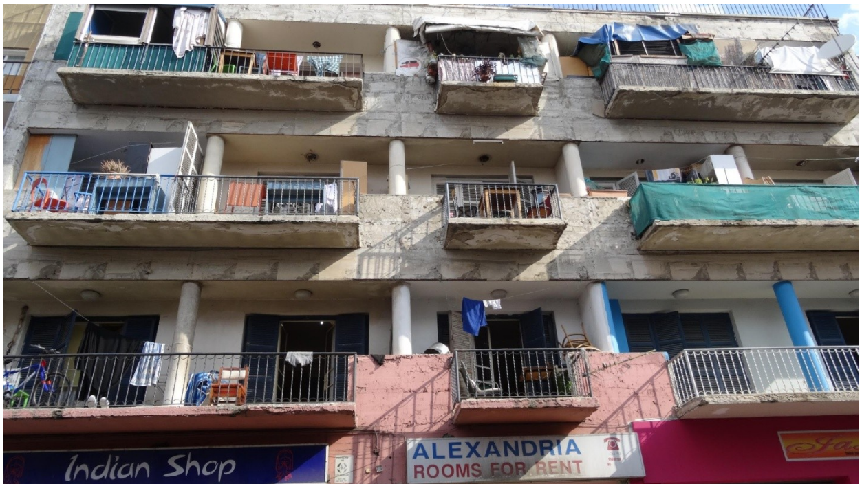
Photographie 5 - Un quartier paupérisé du vieux centre habité par une population majoritairement immigrée (Rue Trikoupis, Nicosie sud, Sabrié, 2017)

Avant qu'un nouveau regard soit porté depuis une petite décennie sur la vieille ville fortifiée, les habitations désertées ont vu apparaître une nouvelle population, notamment d'immigrés, attirés par le bas coût des locations. Après le départ des Chypriotes grecs hors de la vieille ville en 1974, ces communautés immigrées se sont octroyé les bâtiments délaissés et plus généralement les quartiers dans lesquels les Chypriotes grecs craignaient de revenir vivre, en raison de leur proximité avec le front. Deux quartiers en particulier - celui du rond-point OXI (Photographie 4), et celui des environs de la rue Rigenis (Photographie 5) - sont si cosmopolites qu'on y parle peu ou