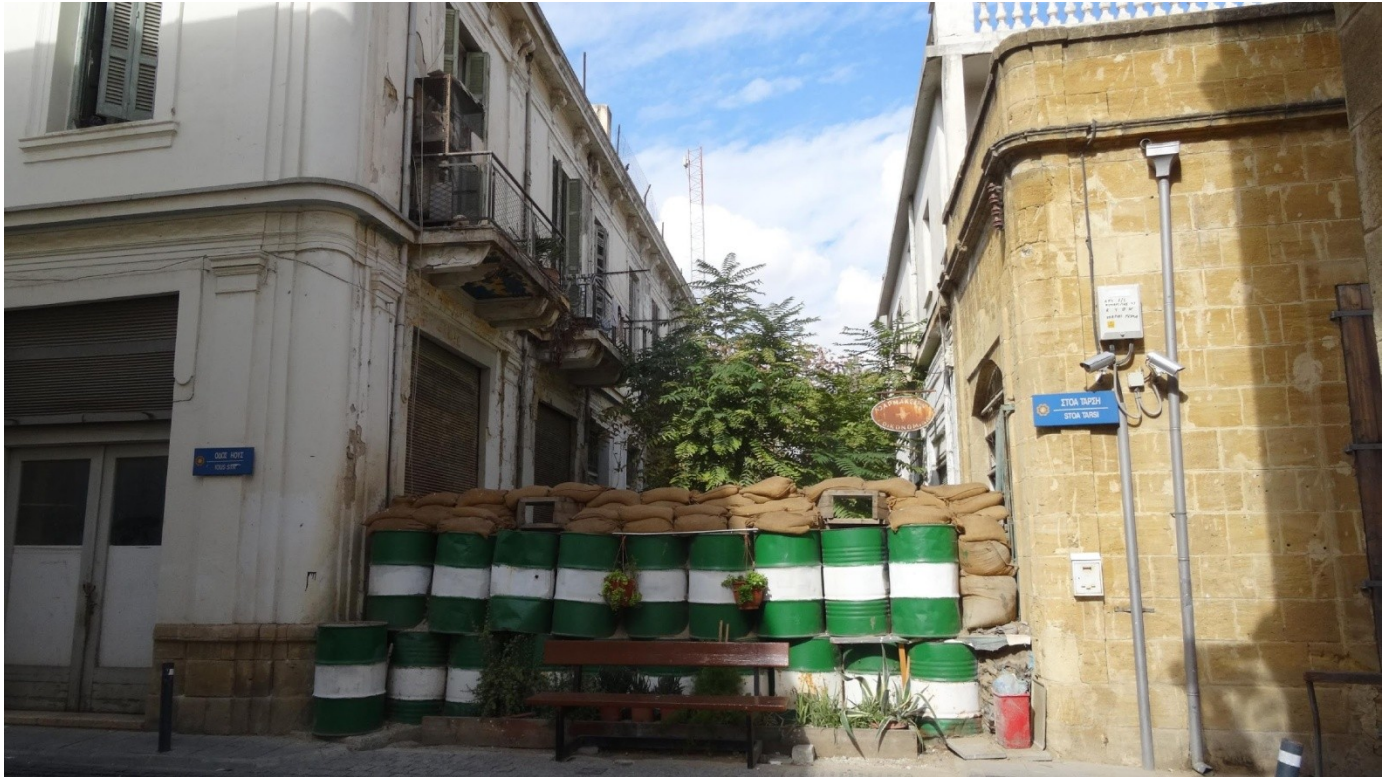
Photographie 2- Un mur de sacs de ciment et de barils toujours debout et surveillé le long de la zone-tampon (Rue Ious, Nicosie sud, Sabrié, 2017)