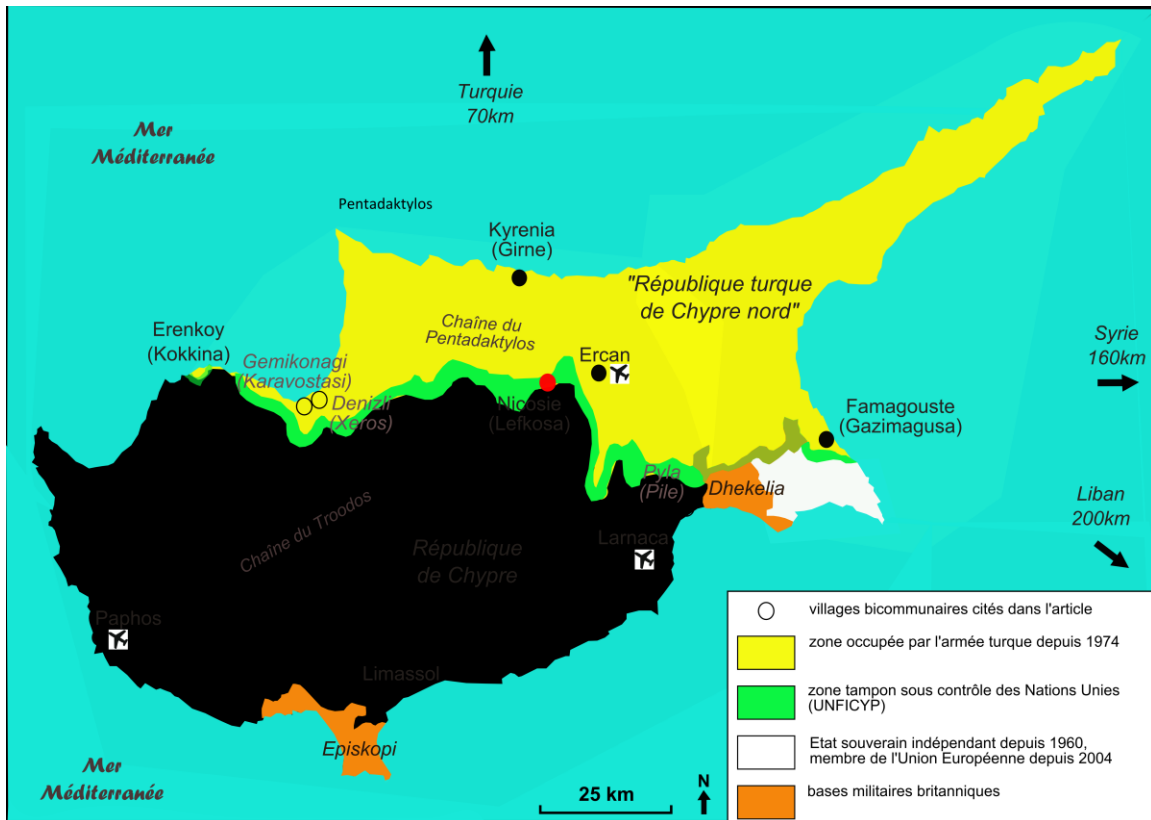
Carte 1- Carte politique de Chypre (Sabrié, 2017)

elles œuvrent à effacer la frontière. Nous concentrerons notre analyse sur le laboratoire de l'urbain que devient Nicosie en nous basant sur des données, principalement qualitatives 4 , récoltées sur le terrain lors d'entretiens, formels et informels, auprès de différents acteurs (citadins, acteurs institutionnels et agents immobiliers) pendant deux ans (2015-2017) et lors d'un séjour de recherche d'une semaine en 2004 (très utile dans nos visées comparatives des aménagements urbains de Nicosie effectués depuis). Au-delà de la question de l'originalité des dynamiques urbaines à Nicosie sud, c'est aussi la problématique des villes divisées par un conflit et des périphéries de l'Europe qui est analysée.