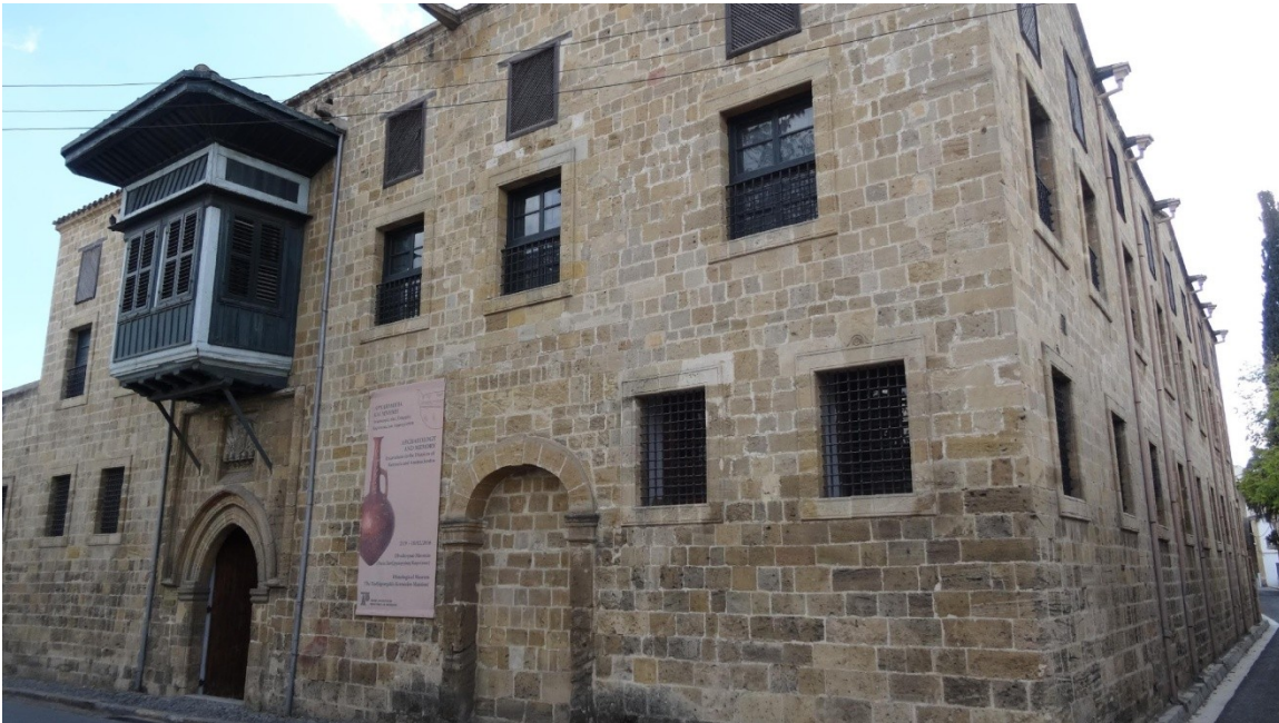
Photographie 7- Demeure médiévale, rénovée et reconvertie en 1988 en musée ethnologique chypriote (Hôtel particulier Hadjigeorgakis Kornesios, rue Patriarchou Grigoriou, Nicosie sud, Sabrié, 2017)

Le vieux centre-ville, un nouveau laboratoire de l'urbain en développement Les friches urbaines qui demeurent, malgré les implantations des communautés immigrées, permettent aussi à la ville fortifiée d'être un laboratoire de l'urbain (Carte 2) grâce aux requalifications des bâtiments. Le Nicosia Master Plan (Plan 1), qui inclut les parties nord et sud de la vieille ville, opte soit pour la rénovation des bâtiments historiques (Photographie 5), soit pour de nouveaux projets plus innovants (le Nicosia Municipal Art Center – le musée d'art contemporain municipal bâti dans une ancienne centrale électrique-, la Shoe Factory – ancienne manufacture de chaussures reconvertie en salle de concerts-, ou bien encore la Galerie Leventis sur les remparts méridionaux) ou d'envergure importante comme la rénovation complète de la rue Ermou où se trouve