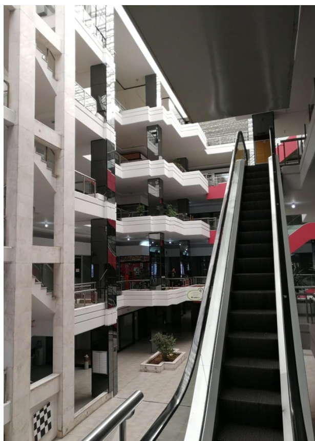
Photographie 4 - Le City Plaza, un centre commercial déserté au cœur du centre-ville moderne (Avenue Makarios, Nicosie sud, Carmenos, 2017)