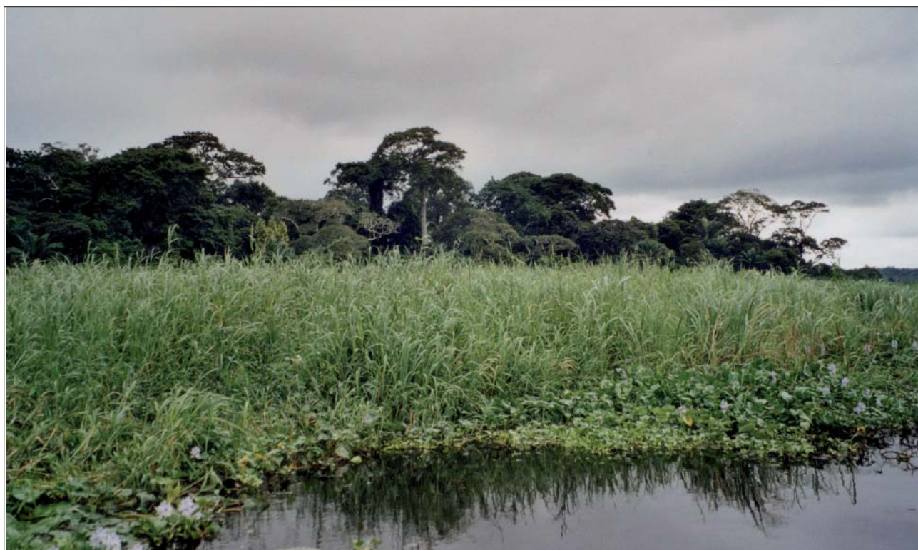
Fig. 3 : Plateau d'Allada, Yorozoun : forêt cimetière, ancien site d'habitat