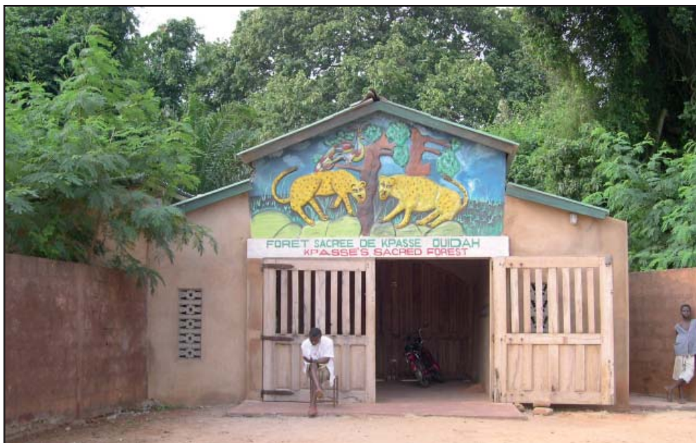
Fig. 1 : Ouidah, entrée de la forêt sacrée de Kpassèzoun