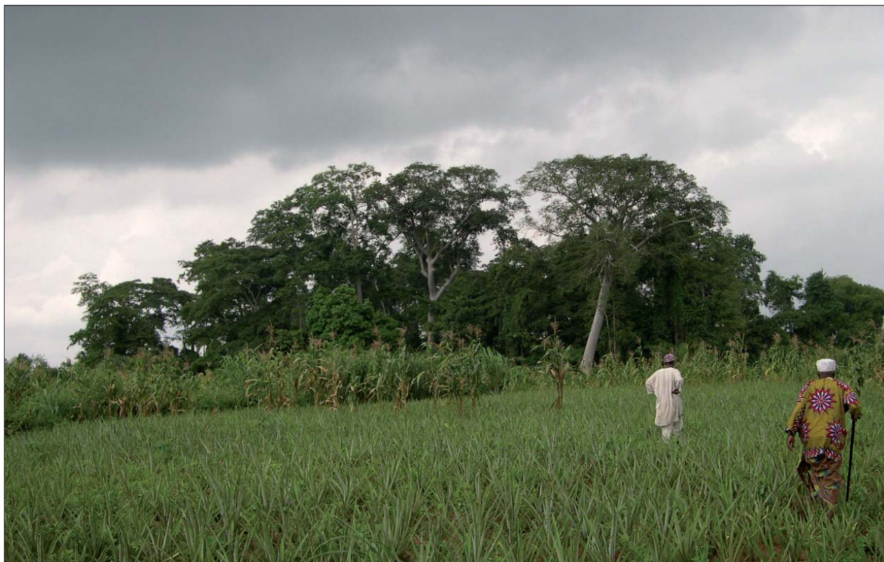
Fig. 2 : Bamèzoun (village de Bembé, Ouémé, Bénin): forêt sacrée, site classé Ramsar, devient réserve biologique