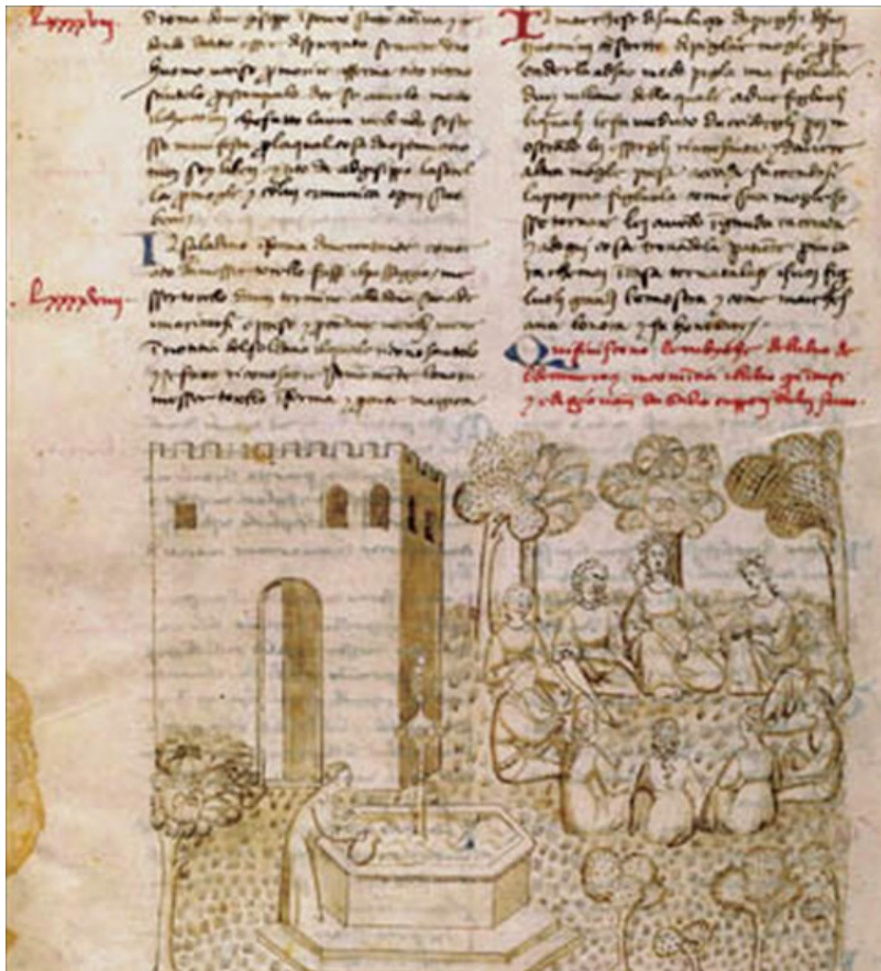
Fig. 1. Il Decameron di G. Boccacci, con alcuni disegni a penna, s.d., conservé à la BnF, (cote : italien 482), folio 4v.

Divers points d'ancrage peuvent donc expliquer cette pratique titulaire. L'héritage littéraire des siècles qui ont précédé le livre imprimé construit le jardin à la fois comme un lieu de structuration des connaissances, un champ d'exposition des doctrines et un procédé narratif.