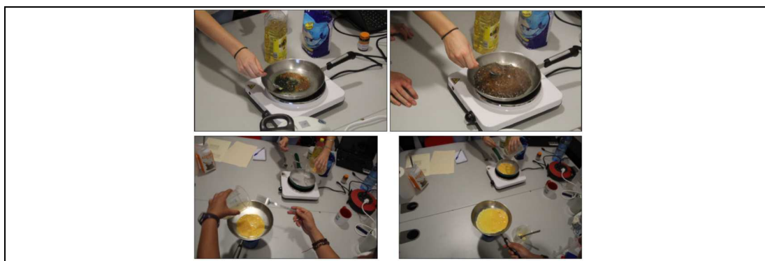
Figura 2. Experimentación piloto del segundo rincón de la innovación