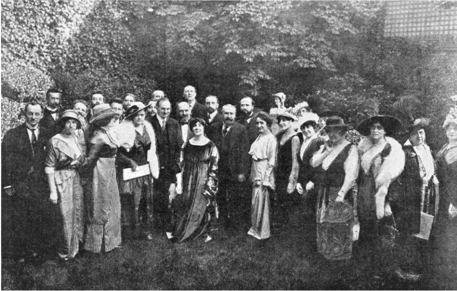
Figure 3 • Chez Madame la Princesse E. de Polignac, « Le cinquième congrès de la Société internationale de musique », dans La Revue musicale S.I.M. , 10 (juil.-août 1914), p. 20

à la SIM, l'IMS n'acceptait en son sein que des « professionnels » et, en 1928, ses onze membres français ne comprenaient qu'une seule femme, Yvonne Rokseth (1890-1948). Tous pays confondus, l'IMS ne comptait que 11 femmes sur 164 membres, soit 6,7% 23 .