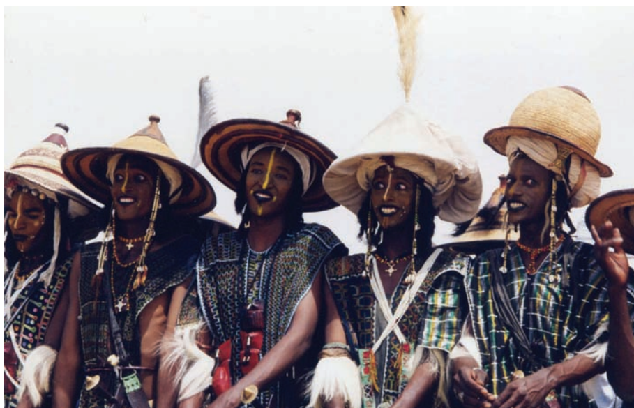
Figura 1: Yaake , linhagem Bii Korony'en. Abalak, Níger, 1996.

conta a dimensão estética e coreográfica das expressões do rosto na yaake . Pois estas não somente acompanham o movimento; elas fazem parte integrante da coreografia para os WoDaaBe . Usar um vocabulário coreográfico, com sua dimensão técnica, representa por isso um desafio considerável. Por um lado, ele pode participar no reconhecimento de um aspecto central nas concepções dos agentes e em uma descrição mais precisa do gesto realizado 7 . Por outro lado, ele pode ser etnocêntrico pela concepção do corpo e do movimento que implica, ou apresentar certos limites. O rosto, por exemplo, nem sempre foi incluído num glossário específico muito extenso no que diz respeito às danças europeias. Tudo isto manda o antropólogo da dança de volta às pré-estruturações de seu projeto. E a continuação da escrita da yaake permite aprofundar este ponto.