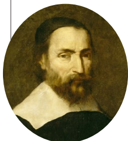
▲ Fabrice de Peiresc (1580-1637)

Pour acquérir et diffuser la connaissance, Fabrice de Peiresc, un érudit provençal du XVII e siècle, tisse un réseau de correspondants et d'échanges épistolaires dont les principes et l'ampleur en font un ancêtre de la Toile.