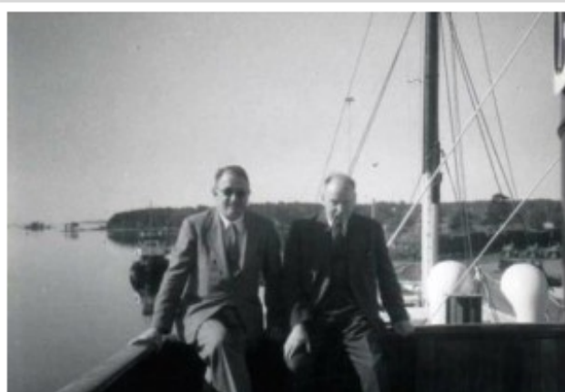
Harry Wexler et Carl-Gustav Rossby à Woods Hole, en mai 1956.