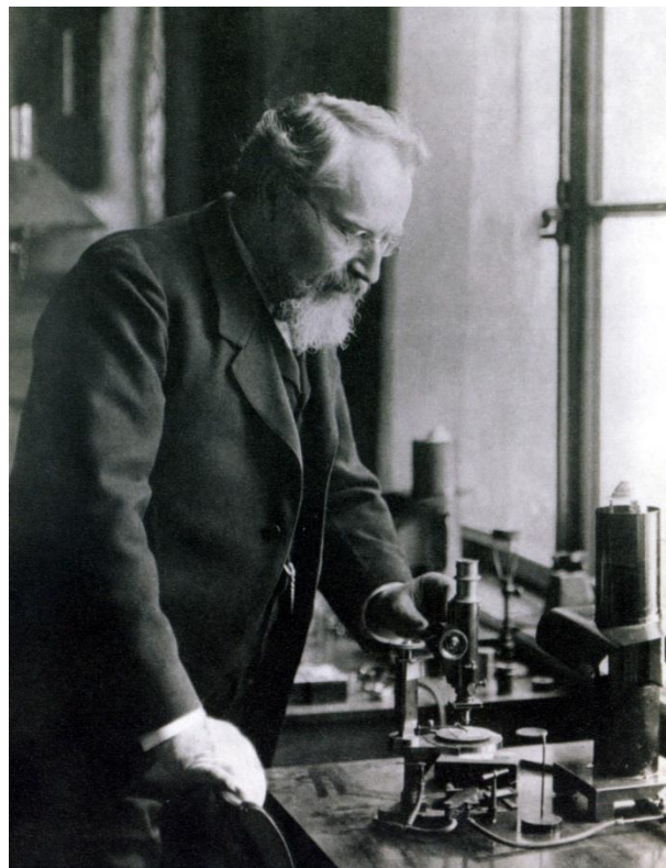
1. Otto Lehmann en 1907, dans son laboratoire à l'université de Karlsruhe.

La trajectoire des cristaux liquides — d'une racine charnue, douce et sucrée, à un écran plat — débute par une lettre, seize pages de caractères gothiques, que Reinitzer écrit le 14 mars 1888 à un physicien allemand d'Aix-la-Chapelle : Otto Lehmann. Le botaniste lui raconte des expériences extraordinaires sur ses cristaux extraits de la carotte. Plus un chercheur est étonné par ce qu'il observe, plus il est content. Reinitzer est content : les cristaux ne se comportent pas du tout comme il pouvait s'y attendre. Ils deviennent fluides à 145,5°C mais en conservant leur couleur bleutée, perdue plus tard, à 178,5°C. Or un cristal, lorsqu'il est coloré, perd solidité et couleur à une seule et unique température. Les connaissances académiques de l'époque sont sans équivoque. Ce comportement surprenant, Reinitzer s'est arrêté dessus et le relate en détails dans sa lettre.