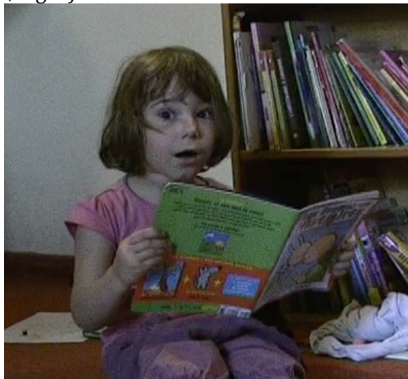
Fig. 5. Lecture expressive

Dans cet extrait, Anaé fait également usage d'une coordination complexe entre actions et productions langagières en proposant une lecture expressive de l'histoire tout en créant des temps d'attente et en dilatant ainsi la structure temporelle des événements décrits. Ce temps d'attente est matérialisé par des allongements de syllabes (« que c'était la nuit ::: ») et l'utilisation de formules propres à la narration bien que non conventionnelles (« et tout un moment »). L'expressivité de la lecture est véhiculée par des montées mélodiques, des contours prosodiques montants descendants (« et tout ↗ un ↘ moment ↗ ») qui sont associés à des mimiques faciales comme les haussements de sourcils et la mimique de surprise exprimée par la bouche en forme de O quand elle dit « et petit soleil roula ! » (1.58, Fig. 5).