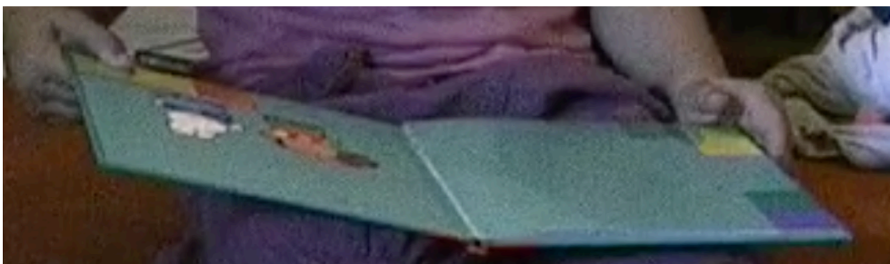
Fig. 3. Image de la double page intérieure du livre "Petit Lapin Blanc dort chez César"