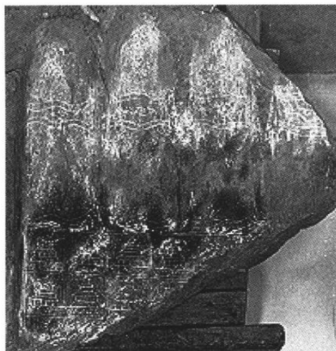
Buddhapāda du Wat Si Chum (Sukhothai)

À côté des inscriptions décrivant d'une façon plus ou moins détaillée des buddhapāda , nous avons également cinq empreintes (dont une double) du Buddha qui sont elles-mêmes inscrites et apportent donc un témoignage encore plus direct. Toutes sont datées du XX e siècle de l'ère bouddhique (= 1357-1457) et sont pour l'instant rattachées à la culture de Sukhothai, voire aux débuts de celle d'Ayuthya. Étant donné les différences importantes qui les opposent, il est nécessaire de les étudier séparément.