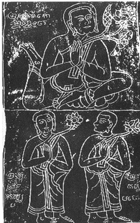
Détail du buddhapāda du Wat Sadet (musée national de Bangkok)

Le second buddhapāda inscrit est celui du Wat Sadet de Kampheng Phet 66 . Conservé aujourd'hui au musée national de Bangkok, il consiste en une lourde plaque de métal rectangulaire dont deux grands angles ont disparu. L'empreinte proprement dite comporte en son centre un grand cakra divisé en plusieurs cercles concentriques. Ces derniers contiennent la plupart des 108 signes auspicioseux alors que les prāsāda , occupant une place à part, sont posés sur le bord extérieur de la roue. Trois grandes bandes sur lesquelles sont gravées des séries de personnages encadrent encore le buddhapāda . L'une est verticale et se divise en cinq panneaux où se répartissent, différenciées par leur taille et par leur posture, huit figures dont les noms sont inscrits. Les deux autres bandes sont horizontales et reproduisent chacune, à une échelle différente, une rangée de personnages debout qu'une inscription linéaire permet également d'identifier. Le dessin est stéréotypé. Un premier coup d'œil permet d'assurer que la bande supérieure représente des Buddha, alors que la bande inférieure figure des moines dont on montre alternativement la face et le profil. Les deux bandes (ainsi que les inscriptions) se révèlent cependant incomplètes en raison de la cassure des deux angles du côté droit. Une troisième ligne inscrite horizontale, placée sur un des rebords de l'empreinte, offre par ailleurs des informations sur la donation même de l'objet. Nous étudierons chacune de ces inscriptions séparément.