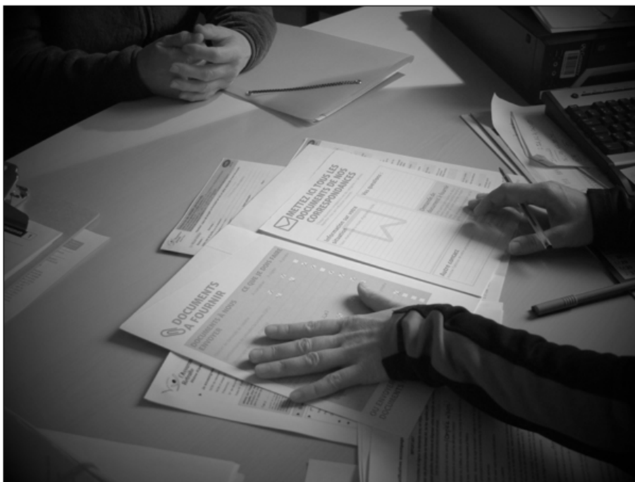
Figure 2 Maquette de dossier assemblant les astuces des conseillères testée lors d'un entretien individuel, décembre 2014.

L'immersion fut également l'occasion de recueillir un certain nombre de « trucs » mobilisés par les conseillères pour aider les assurés à remplir leur dossier : surligner certains champs dans le formulaire, traduire les termes techniques ou ambigus sur un post-it (« le taux plein équivaut à 50 % »), laisser une liste manuscrite des pièces à fournir, ou encore remettre une chemise cartonnée dans laquelle glisser tout le dossier. Ces astuces n'avaient pas pour fonction d'alimenter une quelconque liste de bonnes pratiques qui participeraient d'un gouvernement à distance de l'administration, mais ont été utilisées par les designers pour recomposer le dossier de demande de retraite ( Erreur ! Source du renvoi introuvable. ).