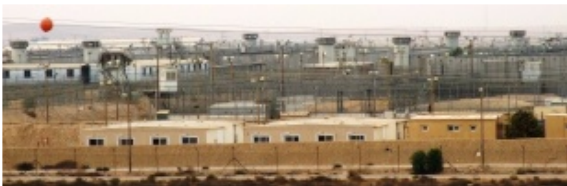
Centre de rétention de Saharonim et prison de Ktziot

Le 1 er novembre 2012, une délégation de journalistes israéliens a pu accéder aux centres de rétention du Néguev. Au moment de leur visite, 1 700 demandeurs d'asile étaient enfermés dans le centre de Saharonim (qui dispose pour l'instant d'une capacité maximale d'enfermement de 3 000 personnes). 800 demandeurs d'asile étaient également détenus à Ktziot dans une aile de la prison réservée aux étrangers 31 .