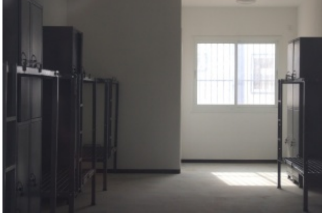
Cellule du centre de rétention de Sadot

Le nombre total de places d'enfermement disponibles dans le désert du Néguev. Des programmes de formation professionnelle devraient bientôt être dispensés au sein de ces camps.