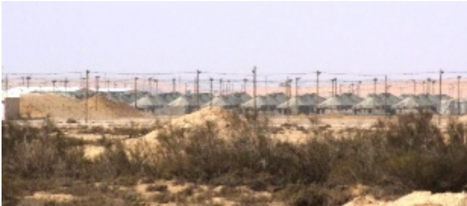
Centre de rétention de Nahal Raviv

Le camp de Nahal Raviv est également situé dans la zone des centres de Ktziot et Saharonim. Disposant déjà d'une capacité de 2 000 places, une fois les travaux terminés, 4 000 personnes pourront y être maintenues sous des tentes, à l'image de celles que l'on trouve à Saharonim. Si le nombre de détenus dans les camps de Ktziot, Saharonim, Sadot et Nahal Raviv, venait à atteindre la capacité maximale de l'ensemble de ces lieux, les autorités israéliennes disposent d'une autorisation leur permettant de construire trois autres centres de rétention, ce qui élèverait à 30 000 le