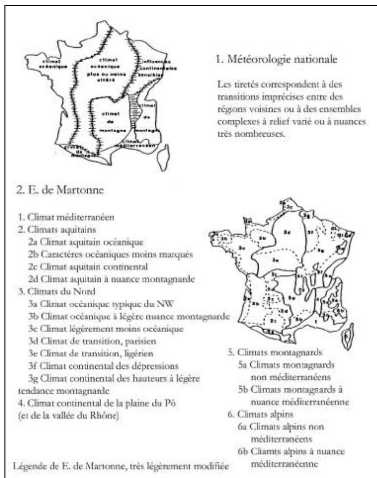
Figure 1 : Deux images classiques des climats de la France (d'après la Météorologie Nationale et d'après E. de Martonne)

NB : Les cartes citées ont été redessinées avec de légères modifications.