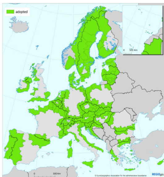
Figure 2 : aires des programmes transfrontaliers financés par le programme communautaire Interreg A (politique de cohésion 2014-2020). Source : DG Regio de la Commission européenne - http://ec.europa.eu