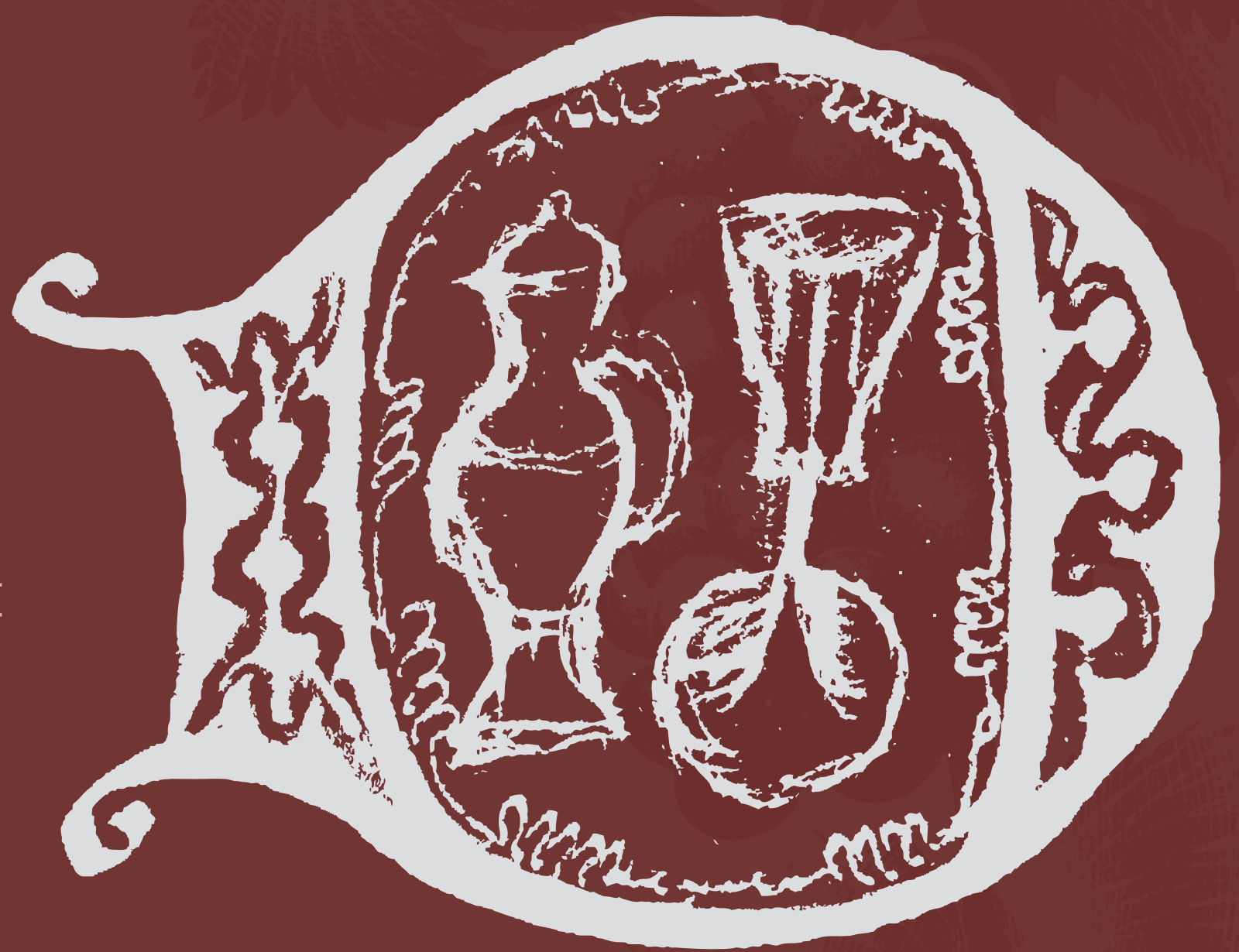
Archives municipales de Tours, CC24, fol. 8r (1426-1427)

Dès 1356, la ville de Tours tient des comptes de ses recettes et dépenses. Ces comptes offrent rarement des scènes décorées. Durant les années 1420, ils présentent toutefois deux images exceptionnelles de verres. La lettrine V, initiant dans le compte de l'année 1421-1422 le chapitre des dépenses « Voiture par terre », montre un visage barbu tourné vers la gauche et humant le contenu d'un verre à jambe creuse soudée à une coupe unie en forme de flûte à base plate (les traits de la jambe débordent sur la base de la coupe). La lettrine D, initiant le chapitre général des dépenses de l'année comptable 1426-1427, présente dans le ventre de la lettre D, dans la moitié gauche un pichet en étain (sans doute la représentation d'un « pot » de vin que la ville de Tours a coutume d'offrir à ses visiteurs importants) et dans la moitié droite un verre à jambe cylindrique pleine, soudée à la base et à une coupe évasée soufflée au moule, avec des côtes verticales reprises à la pince à leur base pour former de petites côtes saillantes.