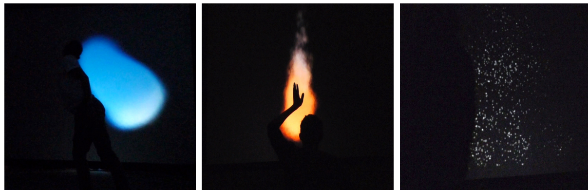
Figure 2 : avatar-bulle