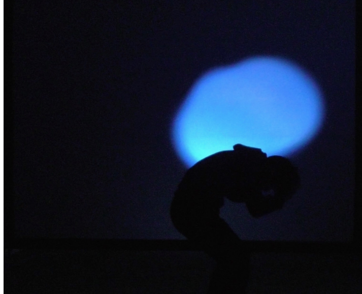
Figure 3 : Murmure