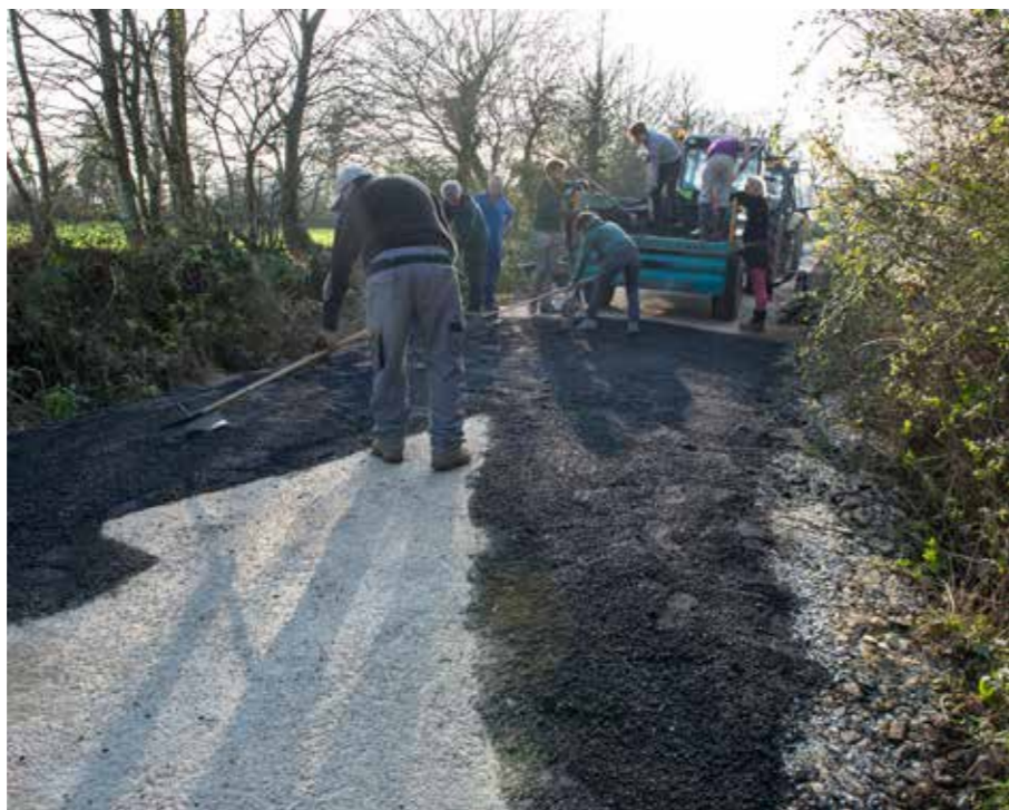
Chantier des quatre saisons – entretien collectif des routes, mars 2017, ZAD NDDL.