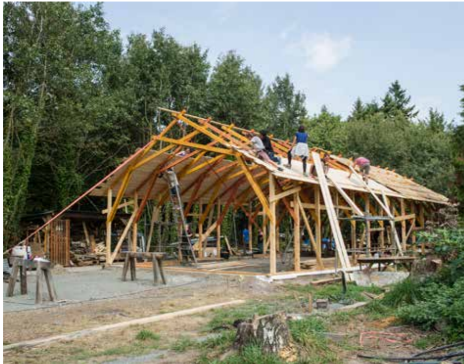
Chantier de construction de l'Ambazada, futur QG intergalactique de luttes, août 2017, ZAD NDDL.

diverses activités. Usages, ça veut aussi dire que ça ne concerne pas que les habitants, mais tous les gens qui pratiquent la zone, les promeneurs, les chasseurs, les motards, les gens qui viennent à la bibliothèque, les groupes qui viennent s'organiser ici, etc. La réflexion bat son plein en ce moment, et c'est hyper-intéressant de réfléchir comment on définit ce que sont ces usages, s'il y a des limites, quelles sont-elles, et, du coup, qui est concerné.