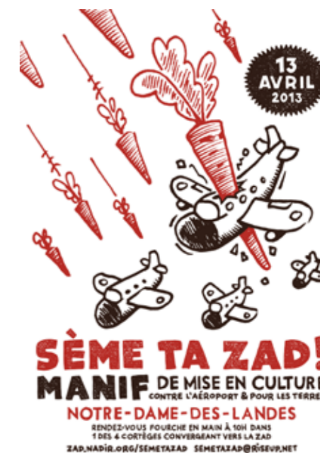
Affiche Sème ta ZAD - version avions et carottes, “Le 13 avril grande manif de mise en culture des terres de la ZAD !”, avril 2013.

On manque parfois de fonds à Sème ta ZAD... On aimerait tendre vers une autonomie financière, mais on a du mal à la rendre durable, une caisse collective, c'est complexe à gérer. En même temps, c'est normal ! Le sujet de l'argent n'est pas simple, c'est beau de porter un truc qui n'a pas pour objectif d'être rentable mais il faut bien alimenter la caisse d'une manière ou d'une autre, rien que pour pouvoir continuer à porter les projets agricoles, et parce que l'idéal qu'on défend derrière, c'est quand même l'autonomie alimentaire."