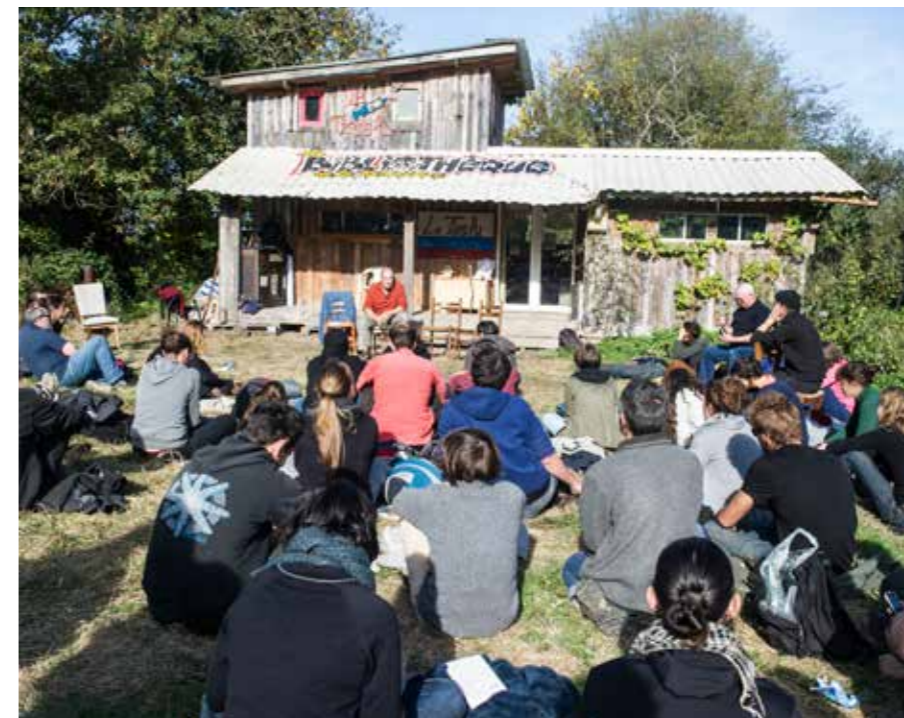
Rencontre avec l'auteur Alain Damasio à la bibliothèque du Taslu, octobre 2016, ZAD NDDL.

pourrait ne sembler qu'un croisement lambda entre deux routes de campagne, mais ça existe comme lieu parce que c'est à la fois raconté et sillonné. C'est aussi parce que le territoire recèle tous ces moments vécus, cette histoire commune accumulée, qu'il est aujourd'hui autant défendu.