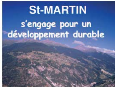
St-Martin s'engage pour un développement durable. St-Martin is committed to sustainable development.

Durchführung: die Wiederinstandstellung der Infrastruktur auf dem Plateau Ossona/Gréferic zur touristischen Nutzung. Die Attraktivierung des touristischen Angebots führt zu vermehrten Übernachtungen.