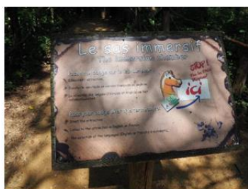
Dispositif d'activation d'une attraction