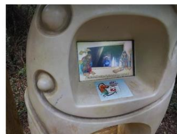
Borne interactive de quantification de l'empreinte carbone