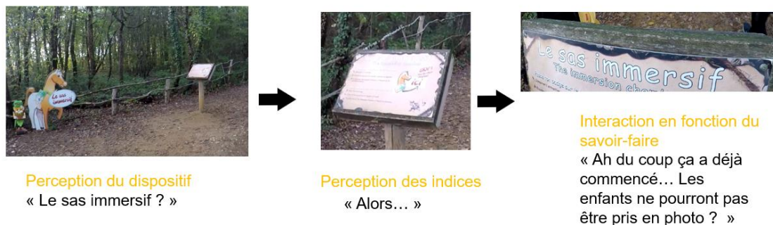
Figure 2 : exemple d'un cas de perception d'un dispositif par un visiteur du parc

La Figure 2 illustre ces étapes en présentant les réactions d'un sujet observé sur notre terrain face au premier dispositif de contrôle d'une attraction du parc.