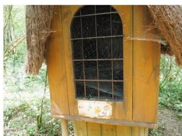
Attraction : court-métrage participant au récit du parc