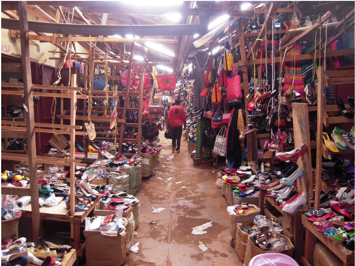
Fig. 2. Section des chaussures sophistiquées et des sacs à main dans Secteur chinois, marché A, Bafoussam (Racaud, 2014)

marchand, la spécialisation jouant un effet significatif sur l'identification et l'attractivité des sous-secteurs.