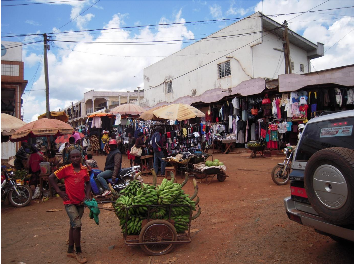
Fig. 1. Limites confuses du marché A, Bafoussam (Racaud, 2014). Légende : l'espace commercial a débordé de l'implantation initiale.

Le marché est officiellement constitué de 2380 boutiques et de 534 étals, soit 2914 commerçants ( Ibidem ). Si on y trouve des commerces de denrées agricoles, les échanges principaux concernent les produits manufacturés. Cette pierre angulaire du commerce est composée d'innombrables dispositifs variés de vente, de la boutique aux kiosks mobiles, agencés dans un dédale d'artères le plus souvent étroites. A première vue, ce lieu marchand congestionné pourrait sembler désordonné, or il n'en est évidemment rien.