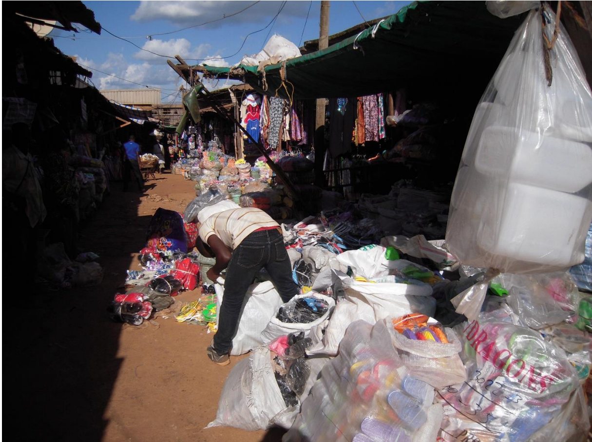
Fig. 3. Section des sandales basiques dans Secteur chinois, marché A, Bafoussam (Racaud, 2014)