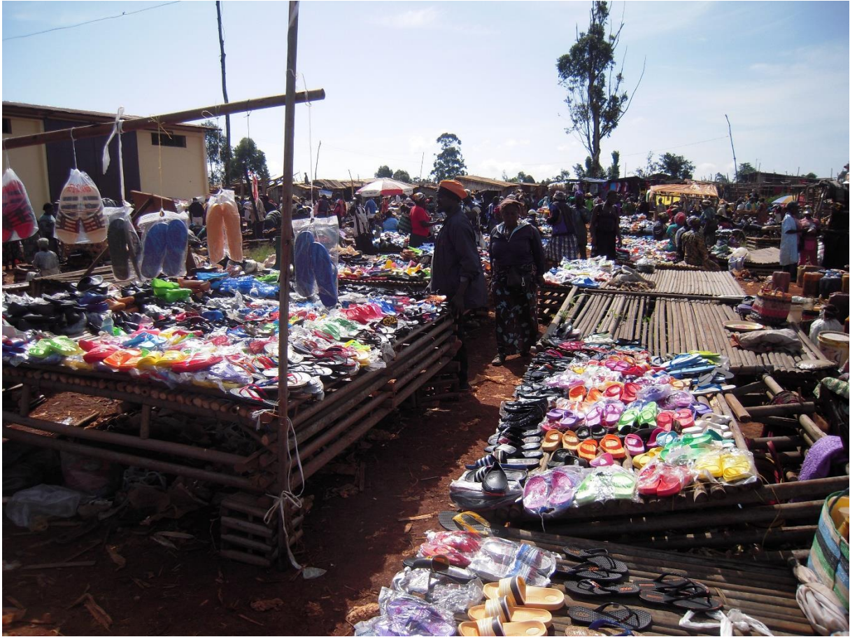
Fig. 5 Secteur des sandales en plastique au marché de Baleveng (Racaud, 2014)