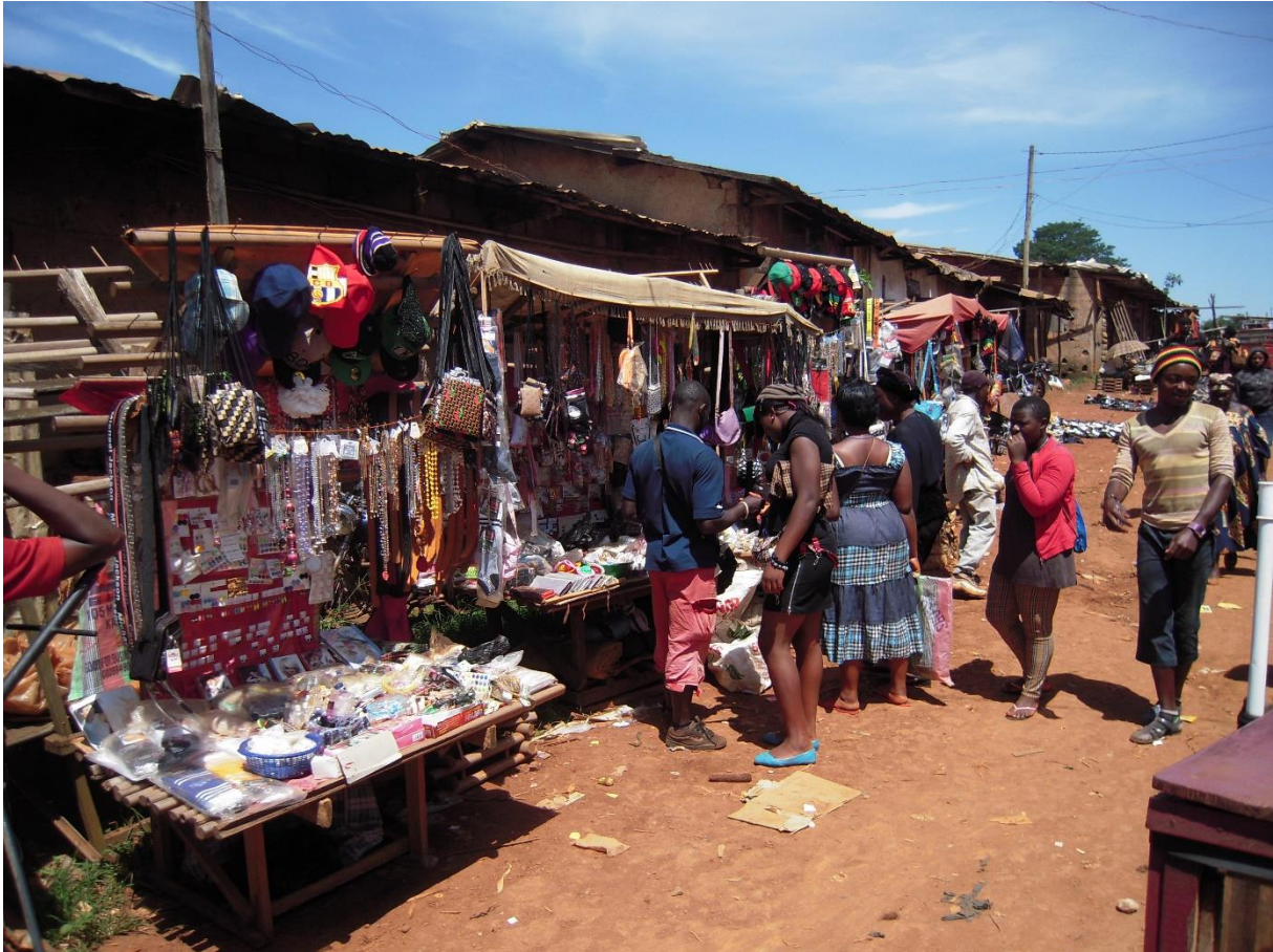
Fig. 8 Jeunesse et objets globalisés dans les campagnes de l'Ouest (Racaud, 2014)

Le marché A et les marchés ruraux organisent à des niveaux différents la circulation de la pacotille chinoise dans ces périphéries de la mondialisation. Cette dernière s'appuie donc sur des lieux ancrés d'une part dans leur territoire et d'autre part organisés en réseaux, via les mobilités des commerçants et les relations marchandes.