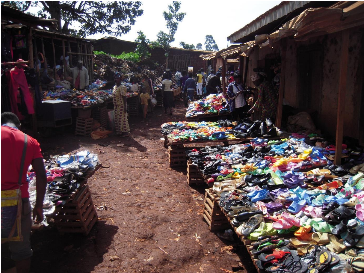
Fig. 6 Secteur des sandales en plastique à Batcham (Racaud, 2014)

La proportion des marchandises importées entre les différents marchés est relativement homogène. Les classements des dispositifs de vente par produits sont relativement similaires : la fripe est le premier groupe de produits, suivi par les vêtements neufs et la layette, puis par la quincaillerie/épicerie ou les sandales/ chaussures en plastique, et enfin par les accessoires de mode.