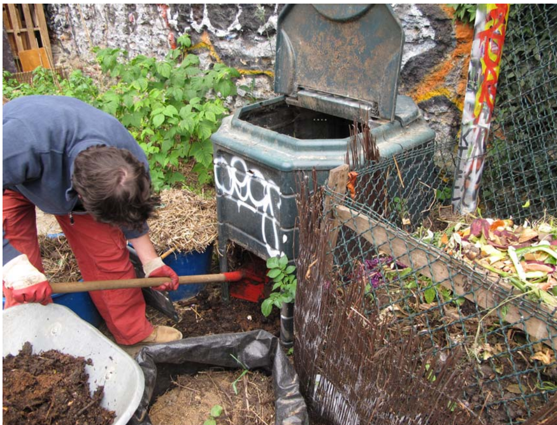
Pratique du compostage dans un jardin partagé du 18 e arrondissement à Paris.

des plantes, le développement des arbres et le trafic léger. Ainsi, ils doivent avoir une capacité portante, des propriétés agronomiques et une capacité de drainage adéquates. De plus, ils doivent se conformer aux restrictions environnementales pour empêcher les rejets de polluants dans l'environnement. Le programme national de recherche (SITERRE, 2011-16) financé par l'ADEME a été consacré à la construction de sols avec des déchets urbains pour l'écologisation des villes, comme alternative à la consommation de ressources naturelles. Les objectifs du programme étaient: (1) d'exprimer les propriétés attendues des sols qui pourraient remplir de façon optimale les principales utilisations des terres vertes en termes de fertilité, capacité portante et impacts environnementaux, (2) définir des indicateurs pertinents de fertilité du sol et (3) proposer des profils de conception de sol construits liés à l'utilisation des terres, (4) identifier et rapporter les déchets pouvant convenir à la construction du sol, (5) évaluer l'évolution des propriétés agronomiques des sols dans des conditions in situ, et (6) vérifier la sécurité des mélanges pour l'environnement et la santé des habitants.