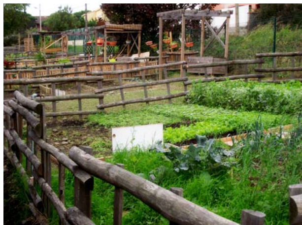
Les jardins collectifs de Monlong accueillent des populations de tous les pays qui n'hésitent pas à tester des pratiques de culture innovantes.

Longtemps considérée comme un phénomène de mode, l'agriculture urbaine s'installe progressivement en France et dans le monde. Aujourd'hui, bien plus qu'une simple tendance, l'AU devient une vraie prise de conscience, en renforçant en particulier les liens entre urbains et périurbains.