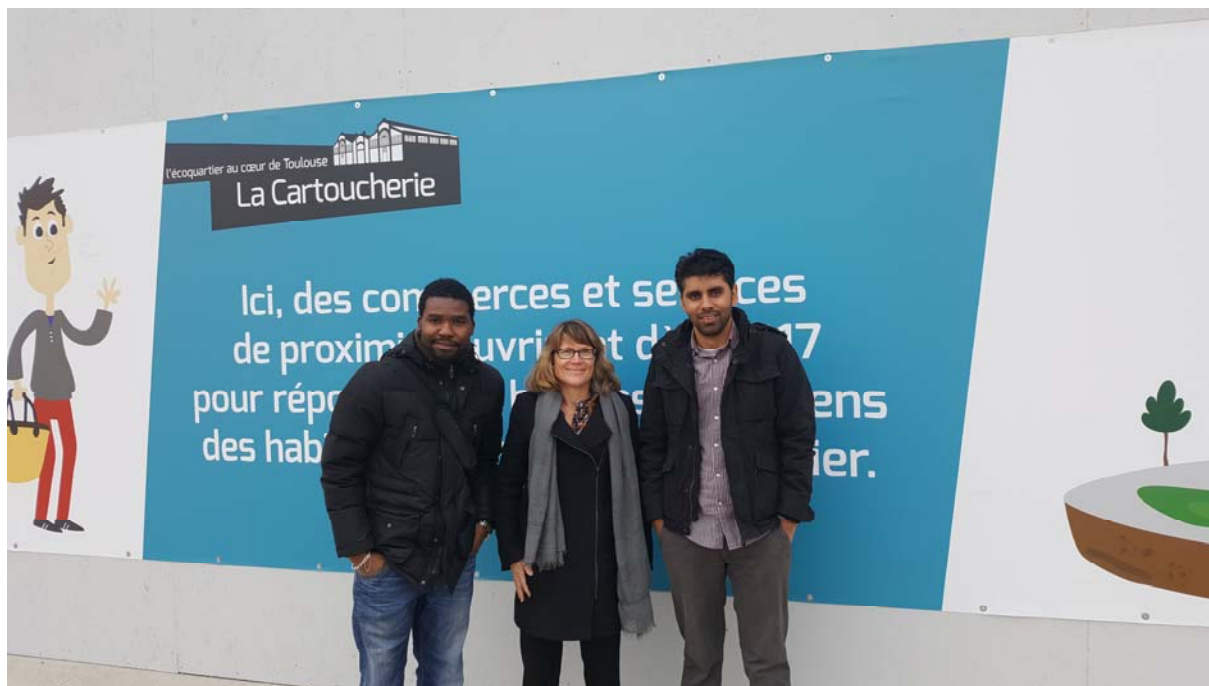
Le site de la Cartoucherie en plein cœur de Toulouse est une friche industrielle polluée aux métaux lourds qui a été décontaminée pour faire place à un éco quartier en 2016.

Ressource » a été aménagé dans le quartier de Fives à l'est de Lille pour permettre aux personnes le souhaitant de créer leur propre espace de culture. A l'avenir, d'autres espaces seraient également à créer afin de développer un réseau agricole au sein des villes.