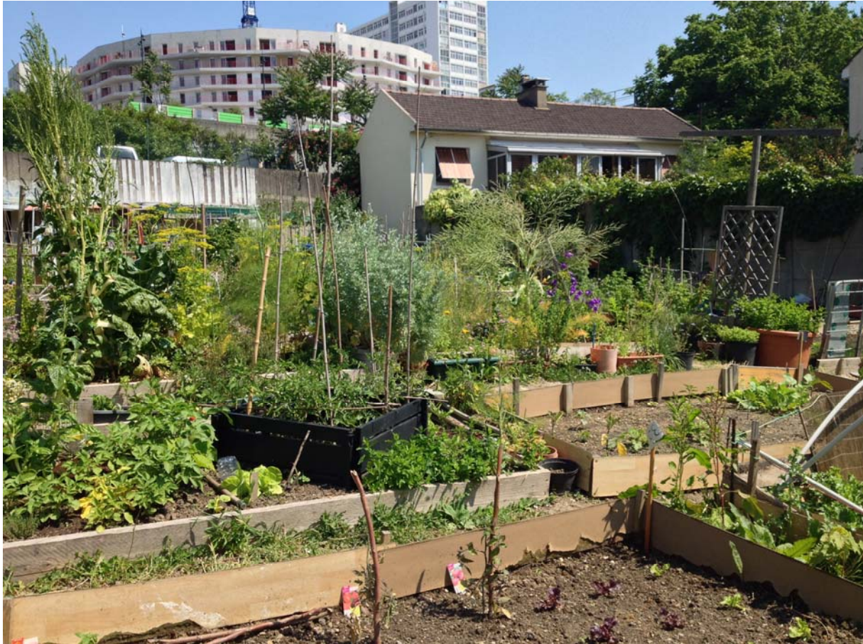
Des jardins partagés à Bagnex dans les Hauts-de-Seine.

L'activité processus d'interaction intelligente d'un opérateur avec les exigences de sa tâche, les contraintes de l'environnement, son état interne, ses objectifs individuels, résultent d'une construction personnelle à celui-ci. Entretien semi-directifs avec les jardiniers, observations, et recueil de verbatims. Les principaux résultats ont montré une catégorisation des jardiniers. Certains recherchent à cultiver des végétaux « bons pour la santé », d'autres viennent aux jardins pour faire des rencontres et s'affirmer, et enfin d'autres y voient le moyen de rester en forme. Toutefois, ces diverses facettes sont en forte interaction. Par ailleurs, les jardiniers seniors s'ils viennent aux jardins pour profiter d'une certaine dynamique, induisent également par leur présence des changements dans les pratiques des autres catégories de jardiniers : les