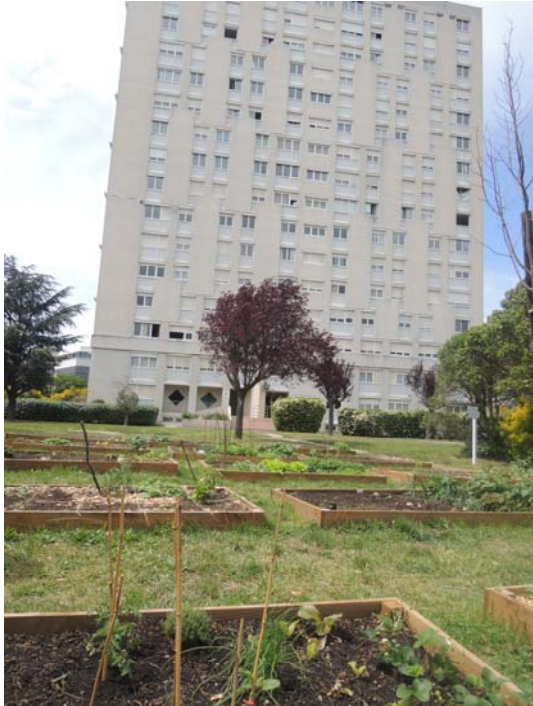
Les espaces verts des habitats collectifs sont de plus en plus remplacés par des paysages comestibles par exemple des jardins en pied d'immeuble (Toulouse Habitat).