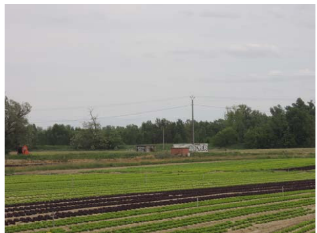
La zone des 15 sols à Blagnac (31) fait l'objet d'un projet de recherche qui accompagne la transition écologique de ce site hybride : productions locales de denrées végétales, zone de loisir, jardins collectifs qui accueillent des écoles en formation à l'environnement.

organiser des pratiques d'AU qui favorisent des villes durables grâce à des symbioses éco-pensées et anticipées est un enjeu crucial ! L'objectif de notre communication est de sensibiliser les acteurs de l'économie circulaire à l'intérêt d'intégrer dans la réflexion la connaissance des cycles biogéochimiques des divers éléments plus ou moins (éco)toxiques et des cycles de vie des différents produits couramment utilisés en zones urbaines. En effet, d'une part la fertilisation raisonnée des sols est réalisée sur la base de la connaissance des cycles biogéochimiques, et d'autre part la gestion durable des substances chimiques en Europe par le règlement REACH est réalisée sur tout le cycle de vie des produits commercialisés. Finalement, en France, le règlement des installations classées pour la protection de l'environnement (ICPE) est basé sur une gestion intégrée des divers milieux sol, eaux, air et impacts (bruit, odeur, pollution...) en raison des nombreux transferts et interactions existant. Les projets d'AU recèlent d'opportunités à saisir pour promouvoir une économie circulaire durable, basée sur la « qualité » des différents produits en lien avec les usages visés. Exemple-1 : Pour un sol urbain ne présentant pas de pollution en métaux persistant, il est pertinent d'entretenir sa fertilité par l'utilisation de plantes engrais-verts qui ont la capacité de solubiliser les minéraux riches en P, K (peu exigeantes) et fixer l'azote atmosphérique (ex. des