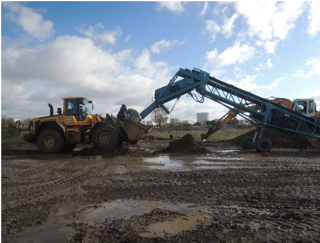
Sur le sujet crucial de la gestion des sols pollués des collaborations internationales sont mises en œuvre. Exemple du Réseau-Agriville qui implique des chercheurs du Gabon, du Pakistan et de la France en visite sur le site de la Cartoucherie.

De nombreux produits chimiques peuvent circuler ou s'accumuler dans les sols urbains (Galitskova et Murzayeva, 2016) et dans les cultures (Clinard et al., 2015). En raison de la complexité des mécanismes bio-physico-chimiques impliqués dans le transfert de substances dans les écosystèmes terrestres, les scientifiques peuvent rarement répondre simplement à des questions sur la pollution (Goix et al., 2015). La nécessité de pratiques plus respectueuses de l'environnement s'impose (Dumat et al., 2016).