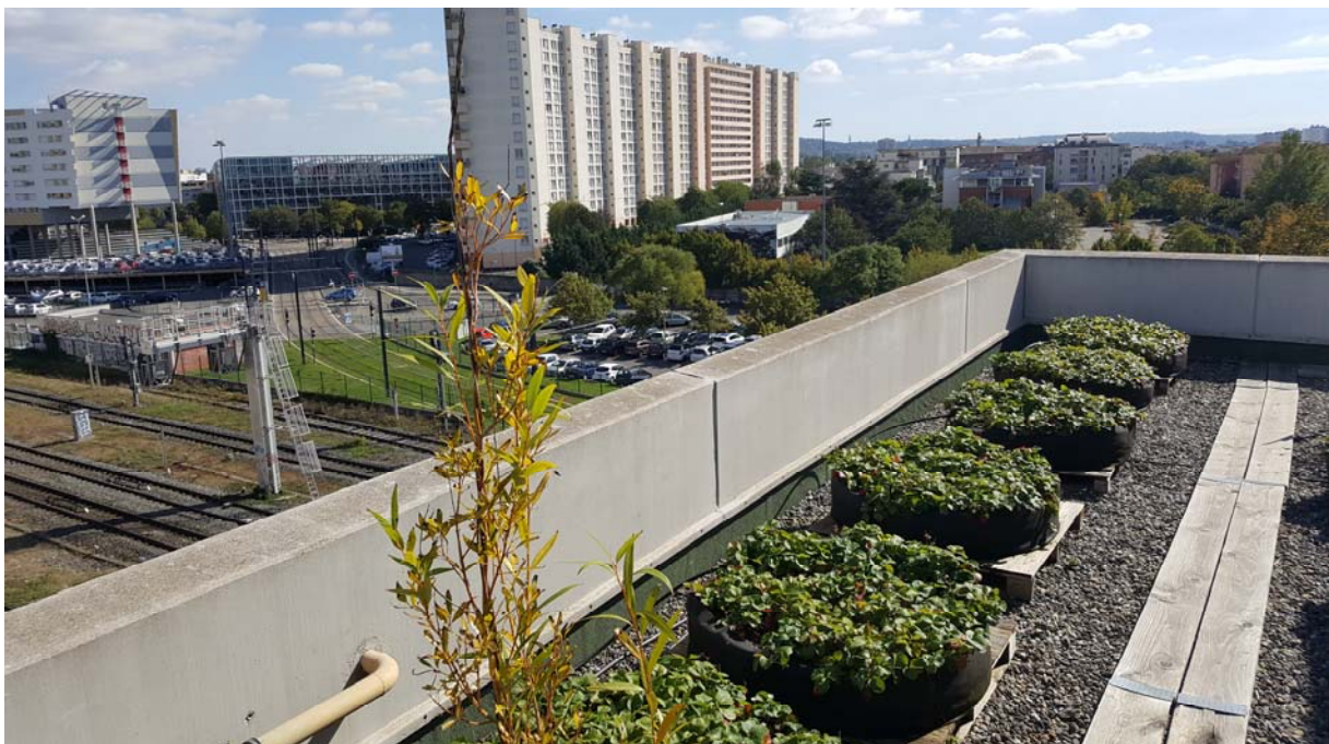
Des potagers sur les toits se multiplient dans les villes du monde. A Toulouse la clinique Pasteur a aménagé des cultures variées pour agrémenter les repas des patients et favoriser la communication sur l'alimentation comme vecteur de santé. Photo : Camille Dumat, 2018

ville et la campagne (Poulot, 2014). Ailleurs (New-York, Singapour) parce qu'il n'y a plus de place à terre et plus rarement chez nous, les agricultures urbaines prennent de la hauteur. Elles s'installent alors sur les toits, à Montréal avec la Lufa Farm. Le jardin installé en 2013 sur le toit de la Clinique Pasteur à Toulouse fait parti des rares expériences françaises d'agriculture urbaine « suspendue ». 500 m 2 de surface potagère recouvrent la toiture de cet établissement de santé spécialisé en cardiologie et engagé dans une politique de développement durable.