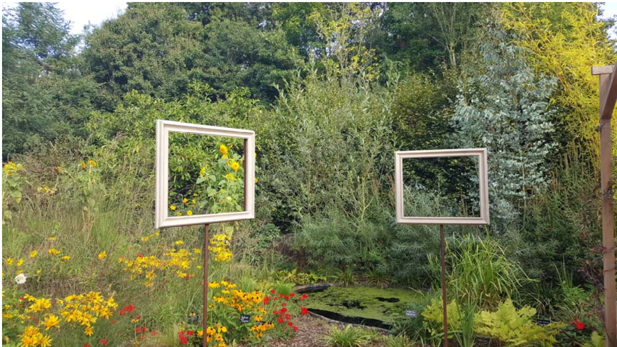
Le domaine de Chaumont sur Loire (41) est un site hybride qui allie beauté des paysages, innovations artistiques, formations à l'environnement. Les paysages sont mis en scène.

d'agriculture complètement insérées dans la ville dense ? Quels sont les projets et leurs auteurs qui soutiennent ces « délocalisations agricoles » ?