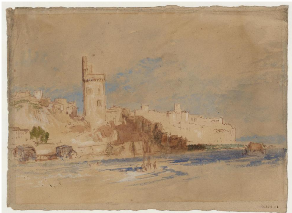
JMW. Turner « Le Rhône à Avignon : la tour Philippe-le-Bel et le fort St-André à Villeneuve-lez-Avignon », 1828, Tate gallery, D28958 (CCXCII 11)