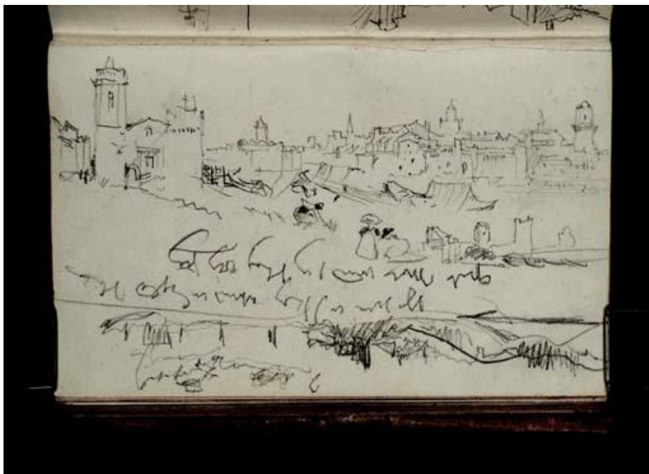
JMW. Turner : Arles vue de Trinquetaille et Tarascon-Beaucaire (inversé, pont suspendu en construction), (1838 ?) Tate gallery D20969 (CCXXIX 34 a) :