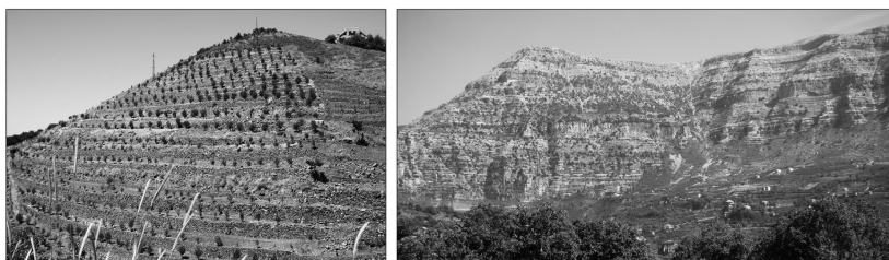
Fig. 2. L'agriculture productiviste et la monoculture du pommier à l'assaut de la montagne, y compris sur les éboulis instables au bas des à-pics (photos P. Poupet, 2010).

reconquête forestière et l'augmentation du risque d'incendie, la diminution des ressources en eau due aux modifications dans le mode d'occupation des sols. Les changements dans la façon d'habiter (résidences secondaires d'été, urbanisme incontrôlé), dans les pratiques agricoles (mécanisation, monoculture du pommier) et dans l'occupation de l'espace (abandon de l'élevage) contribuent à la dégradation irréversible de la montagne (fig. 2).