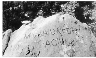
IM Perator HAD rianus AUG ustus DEF initio Silvarum Arborum Genera IV (quator) Cetera Privata