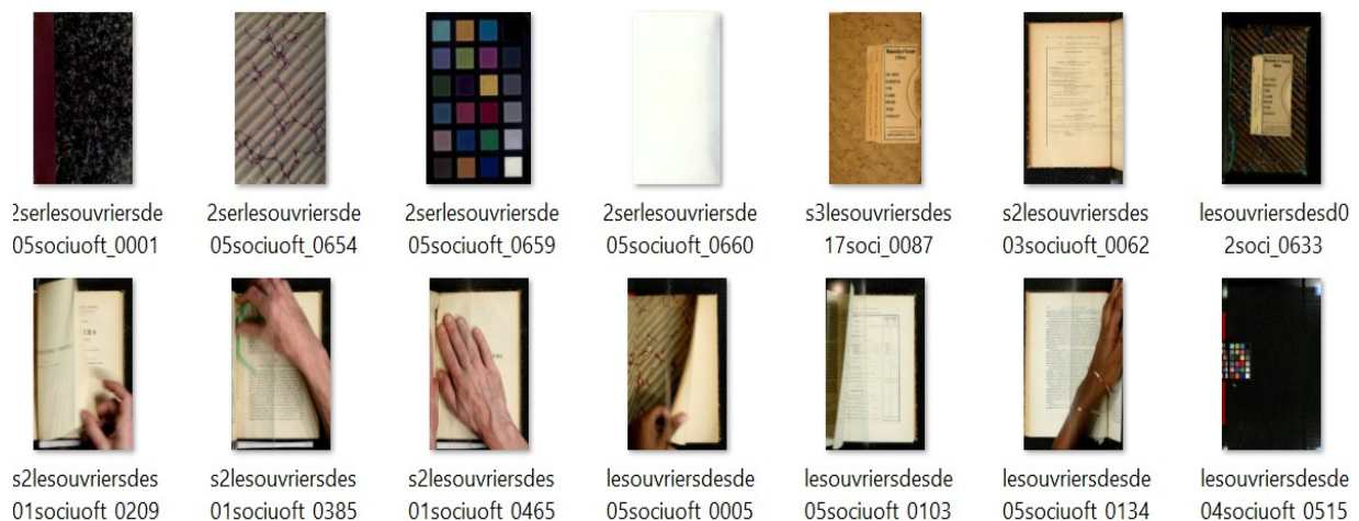
Fig. 1: Quelques erreurs de numérisation

Le corpus rassemblé est un mélange d'archives économiques et d'archives juridiques, manuscrites et imprimées et produites à différentes époques. Dans un premier temps, nous avons souhaité utiliser des sources déjà numérisées résultant de campagnes de numérisations menées par d'autres institutions. Numelyo 7 , la bibliothèque numérique de la ville de Lyon, permet le téléchargement des numérisations des microfilms de la presse lyonnaise du XIXe siècle. Nous avons collecté un total de 390 fichiers PDF par son biais. L'Université de Toronto a publié sur Internet Archive 8 les numérisations de treize volumes appartenant à la série des « Ouvriers des Deux Mondes ». Près de 8 000 fichiers couleurs au format JP2 sont ainsi disponibles. En dépit de la très bonne qualité de ces fichiers, l'ensemble contient des erreurs de numérisation ou des images jugées inutiles pour le projet, qu'il a donc fallu trier.