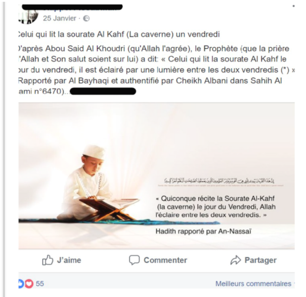
FIGURE 4 – Figure 4 : Extrait de corpus collecté le 25 janvier 2018 sur la page Facebook Rappel Fissabillah.