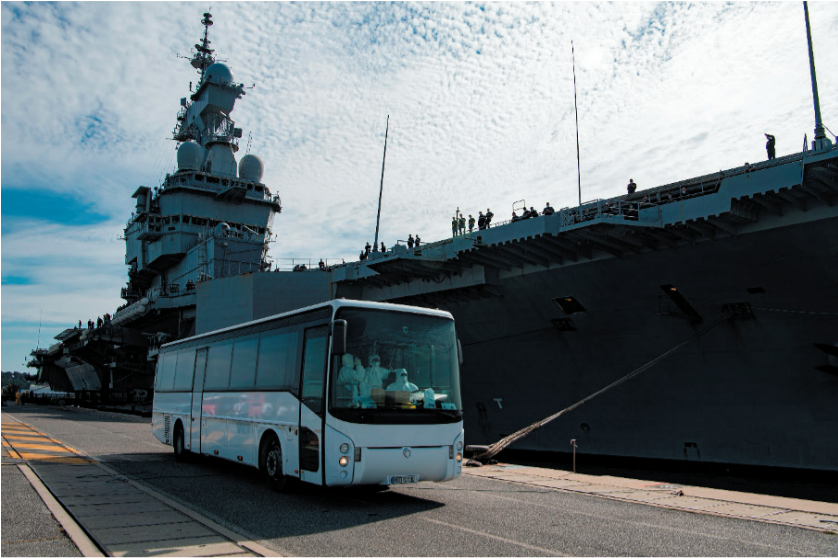
Évacuation par bus des marins du Charles de Gaulle afin d'accomplir une période de quatorzaine dans des enceintes militaires et d'être testés avant de rejoindre leurs foyers. Le porte-avions et son escorte ont rejoint Toulon le 12 avril 2020 au terme de près de trois mois d'opérations en Méditerranée orientale, en Atlantique et en mer du Nord, soit une dizaine de jours avant la date initialement prévue, et ce, en raison de plusieurs dizaines de cas de Covid-19 à leur bord.

la veille, en effet, la fréquentation de l'infirmerie du bord avait connu cette soudaine augmentation conduisant le pacha à en rendre compte à l'état-major de la Marine, indiquait l'amiral Christophe Prazuck lors d'une interview accordée à Mer et Marine le week-end dernier. C'est pourquoi, ce même 7 avril, Florence Parly ordonna l'envoi immédiat d'une équipe du Centre d'épidémiologie et de santé publique des armées (CESPA) à bord du Charles de Gaulle pour réaliser une enquête et une première série de tests qui, le jour d'après, s'avéreront positifs pour 50 militaires sur la soixantaine effectuée à bord.