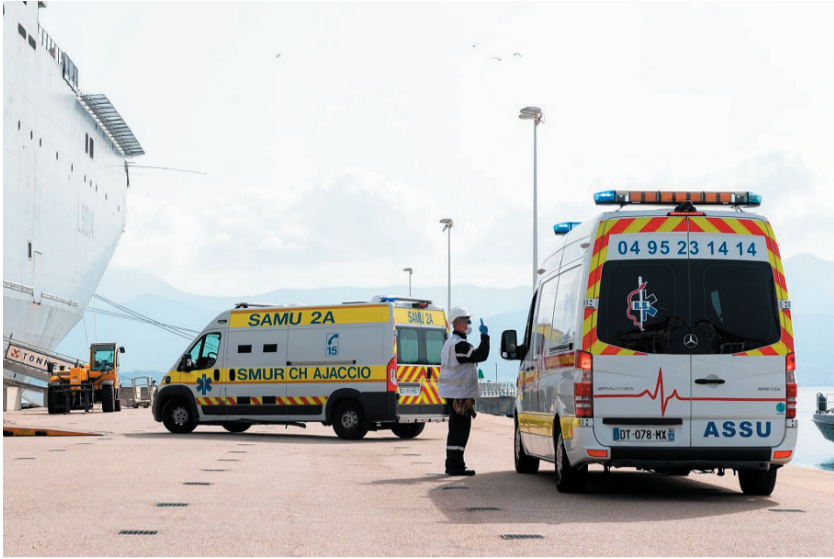
Deux ambulances embarquent à bord du PHA Tonnerre amarré au port d'Ajaccio afin de prendre en charge des patients atteints de la Covid-19 par l'hôpital du bord pour les transférer dans des établissements de santé de la région Provence-Alpes-Côte d'Azur.

Arrivé le 17 avril dans la baie de Marigot, à Saint-Martin, il y débuta sa « tournée logistique » avant de rejoindre le jour suivant la Guadeloupe, où une partie du fret fut embarquée à bord du bâtiment de soutien et d'assistance outre-mer (BSAOM) Dumont d'Urville pour être ensuite délivré à la Guyane, et, dès le lendemain, la Martinique. Si, comme ses « frères jumeaux », ce bâtiment de guerre n'est pas destiné à accueillir des malades souffrant du Covid-19, rien ne l'empêcherait, a priori , de prendre en charge d'autres patients dans l'hôpital embarqué, fort de ses 69 lits (avec extension possible).