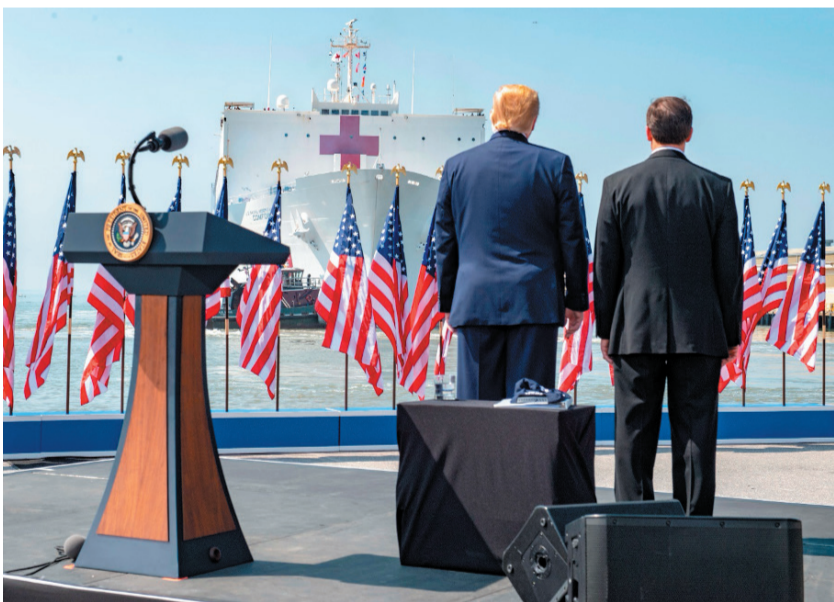
Le président Donald Trump et le secrétaire à la Défense Mark Esper regardent le navire-hôpital USNS Comfort quitter la base navale de Norfolk le 28 mars 2020 pour rejoindre New York en appui aux efforts de lutte contre la Covid-19 aux États-Unis.

« de lui-même » le 7 avril, comme l'appelait de ses vœux le président de la Commission des forces armées de la Chambre des représentants des États-Unis, le démocrate Adam Smith.