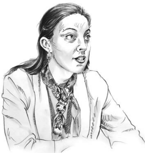
par Agnès Hallosserie, Fondation pour la recherche sur la biodiversité

Les scientifiques qui travaillent depuis des décennies sur cette question, qu'ils soient écologues, sociologues, anthropologues ou encore économistes, unissent leurs voix pour alerter les politiques, mais aussi les collectivités, les entreprises