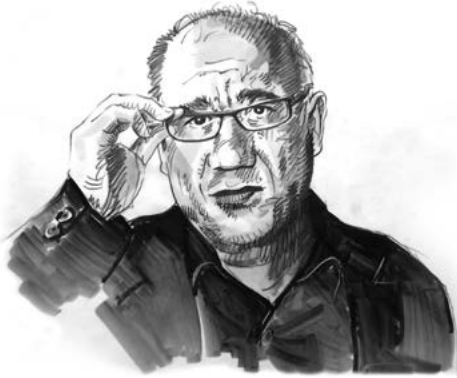
par Sergio Dalla Bernardina, ethnologue.

S ANS compter les morts et les blessés, depuis 2015 nous en sommes à 157 habitations touchées par des munitions de chasse, quatre-vingt-dix-neuf véhicules et vingt et une vaches 1 . Si cela a de quoi exaspérer, notamment les habitants des lotissements pavillonnaires, dans les bois c'est aussi de plus en plus l'angoisse: « Déjà, on ne sait pas si on a le droit de ramasser des champignons (oui, parce que les prés et les forêts, parfois, appartiennent à quelqu'un). Et en plus, habillés aux couleurs de l'automne comme des cèpes ou des grisets, on risque d'essuyer des tirs. Il faudrait circuler avec une veste fluo, peut-être, mais cela attire l'attention. Et on n'est pas sur un rond-point, ici, on n'est pas des Gilets-jaunes. De toute façon ce n'est pas une veste fluo qui va faire la différence. Lorsqu'ils tirent, ils tirent et une balle de Mauser tue un bonhomme à deux kilomètres. Il faudrait abolir la chasse, un point c'est tout. »