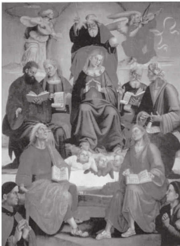
Figure 2. Francesco Signorelli, Pala (1524), Chiesa di Santa Maria al Calcinaio Cortona 8 .

de personnes présentes, puis parce que, loin d'être relégué en bas de la scène, il est presque au niveau de la Vierge, occupant une place à sa gauche.