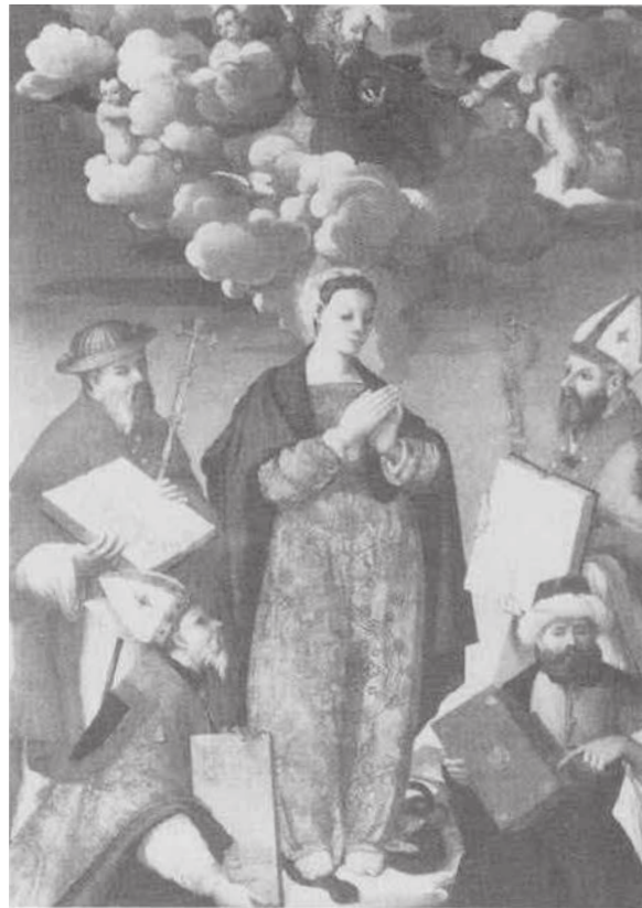
Figure 3 9

la Vierge –, Gentile donne dans le baroque: il place autour de Marie une véritable armée de saints, moines, nonnes, théologiens, papes, évêques et cardinaux. Muhammad et Luther sont certes présents tous les deux, mais ils gisent à terre, tout en bas du tableau, dans une posture qui montre leur statut ambigu: ils semblent plus être des ennemis humiliés que des témoins de vérité, même s'ils portent chacun les livres qui attestent de la pureté de la Vierge.