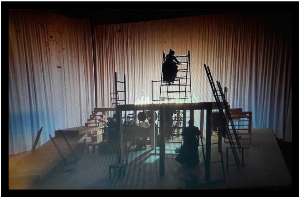
Fig. 1 : Thornfield Hall en flammes. Jane Eyre , National Theatre Production 2015, diffusion National Theatre at Home, avril 2020.

Le décor étant fixe, les différents lieux sont délimités par des jeux de lumière et des zones d'ombre venant ouvrir ou restreindre l'espace, comme lorsque Jane est au chevet d'Hélène mourante. La couleur bleue qui envahit le rideau caractérise Thornfield Hall, demeure de Rochester, archétype de l'architecture gothique, insondable et mystérieuse comme son propriétaire. Ce dernier dit d'ailleurs à ce propos : « I like Thornfield, with its old crow trees and lines of dark windows ». Les fenêtres descendues des cintres s'ouvrent et se ferment pour signifier le passage du temps et des saisons, et renvoient tour à tour à l'enfermement et à l'envie de liberté de Jane. Les lumières descendues elles aussi des cintres, comme sur l'image ci-dessus, rendent l'endroit éblouissant, magique et enchanteur, surtout pour une jeune gouvernante sortie de l'orphelinat.