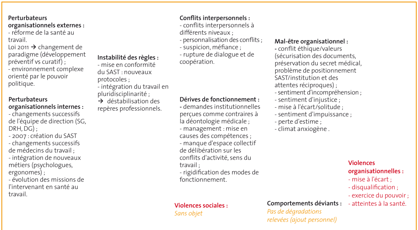
Figure 2 : Modèle d'intervention sur les violences au travail renseigné lors d'une intervention dans un service autonome de santé au travail. (Cf. figure 1 et encadré 2, p. 27)

Le second verbatim consiste en un retour d'expérience de l'usage du modèle durant une session d'intervention au SAST. La séance réunit cinq personnes : les deux psychologues et le médecin du travail de l'entité d'appartenance des deux psychologues (à l'origine de l'alerte) ; le médecin du travail du SAST et la DRH (c'est-à-dire les deux personnes en conflit, objet de l'intervention). L'échange a lieu avec une des deux psychologues intervenantes. Une difficulté imprévue est d'emblée identifiée par l'intervenante : « ils ont été très intéressés par le modèle, mais la difficulté qu'on a eu, c'est que la réunion a été complètement embolisée /... / il y a eu une coalition entre les médecins du