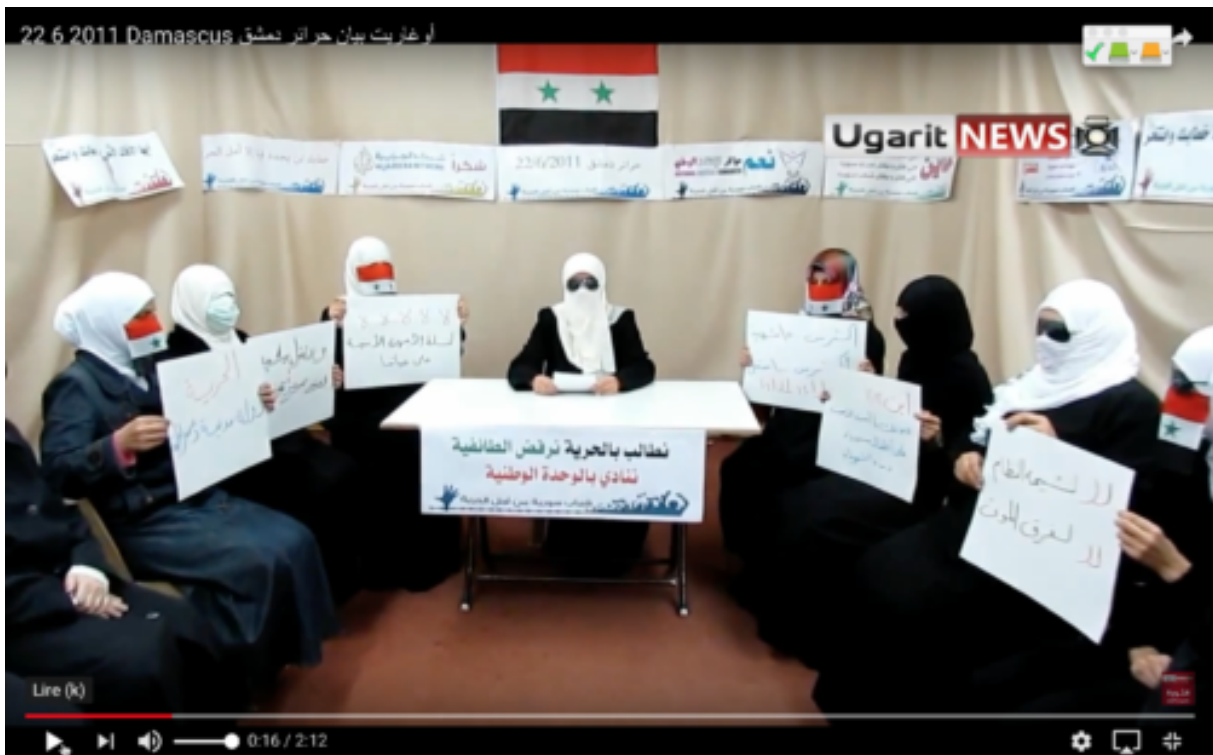
Figure 1 : capture d’écran d’une vidéo des harâ’ir de Damas postée le 22 juin 2011.

Le terme fait l’objet d’un engouement exponentiel dans le camp de l’opposition, notamment sur les réseaux sociaux où de multiples groupes de « harâ’ir » apparaissent le plus souvent attachés à une localité précise : les harâ’ir de Daraya , du Qasyoun , de Mu’adhiyya , de Raqqa , etc. Ces collectifs sont engagés dans des actions sociales et d’aide à la population, notamment dans les régions « libérées » des forces du régime. Quelques-unes de ces femmes annoncent être prêtes à aller plus loin : prendre les armes et rejoindre les hommes au front « pour la révolution et notre patrie ». Sur les vidéos ou photos postées en nombre sur des pages Facebook ou des comptes YouTube, les « harâ’ir » sont strictement voilées et leurs visages dissimulés, probablement pour des raisons aussi bien religieuses que sécuritaires. La tonalité des appels prononcés par ces groupes est avant tout patriotique et citoyenne comme dans une vidéo mise en ligne par les harâ’ir de Damas le 22 juin 2011 : « Nous réclamons la liberté et refusons le professionnalisme. Nous appelons à l’unité nationale » peut-on lire sur la pancarte centrale. Sur une autre « Non, non, non au pouvoir de l’appareil sécuritaire sur nos vies » ou encore : « Liberté pour un état civil et démocratique » (fig.1). En revanche, on ne note aucun appel à l’instauration d’un état islamique ou à un retour aux pratiques qui auraient été en vigueur dans la communauté musulmane à l’époque du Prophète Muhammad.