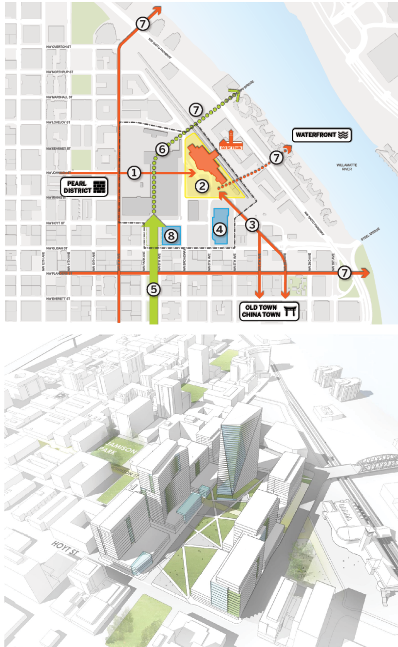
Illustration 4. Union Station et le projet de redéveloppement Broadway Corridor

Le schéma présente les éléments fondamentaux du projet de redéveloppement du quartier : 1) meilleure connexion entre le quartier de gare et Pearl District, 2) renforcement de la gare comme pôle multimodal, 3) amélioration de la voirie vers Old Town Chinatown, 4) redéveloppement du site de l'entreprise Greyhound, 5) et 6) extension de la trame verte et de la végétalisation du site, 7) meilleure intégration du front d'eau, 8) redéveloppement du site de tri postal.