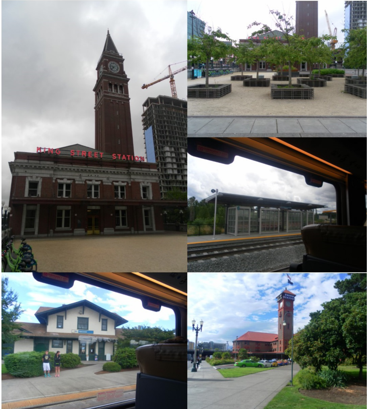
Illustration 2. Les gares du réseau Amtrak : des bâtiments identifiables dans la ville ?

Source : ces photographies personnelles ont été prises lors de mon terrain de recherche de juillet 2016 – les deux photos du dessus représentent la gare Amtrak de Seattle, les troisième et quatrième photos illustrent des petites gares du corridor (Tukwila et Washington, WA) et la dernière la gare de Portland. © Matthieu Schorung