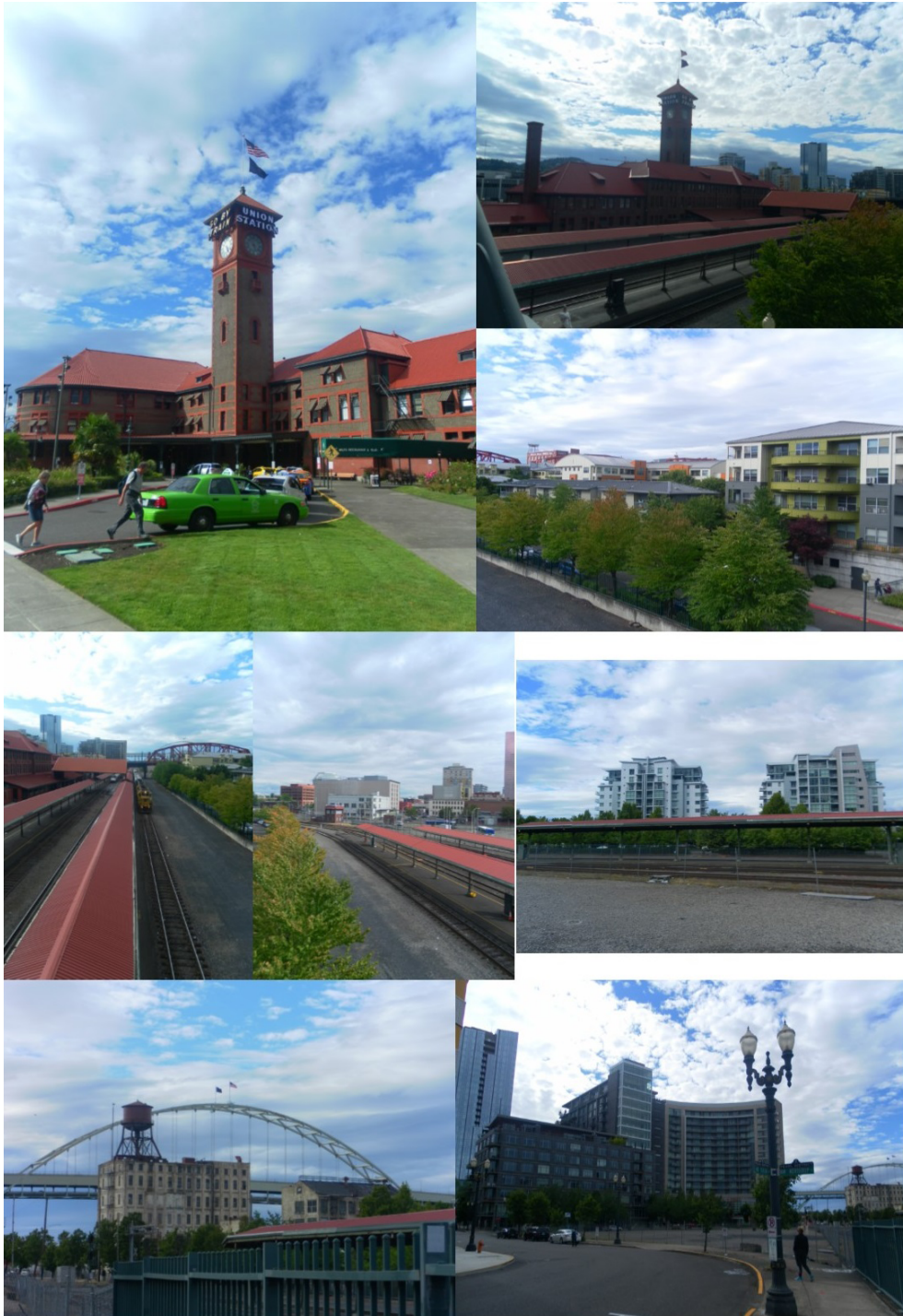
Illustration 3. Union Station et le quartier de gare

Source : ces photographies sont tirées de notre terrain de recherche en juillet 2016 – les deux photos du haut représentent le bâtiment de la gare ; les deux photos horizontales du milieu illustrent l'emprise des quais ; les autres photos l'environnement immédiat de la gare. © Matthieu Schorung