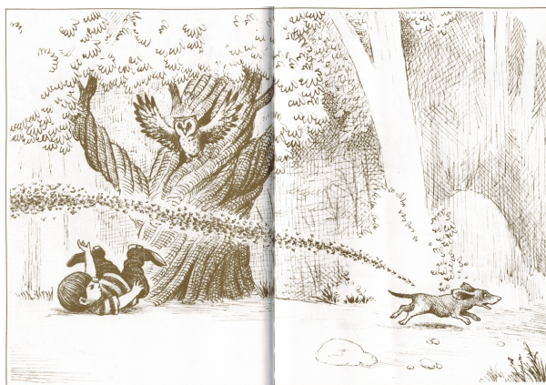
FIGURE 1 – « Frog where are you ? »

Les avantages de cette bande dessinée pour étudier la production orale en continu sont multiples (Slobin, 2004). Elle ne contient aucun texte, il est donc possible de l'utiliser pour l'enseignement/apprentissage de langues différentes et à des niveaux différents. Son intrigue est aisément compréhensible par des publiques de tous âges. Elle relate une longue série d'événements suffisamment complexes pour faire produire un récit détaillé, permettant ainsi des analyses dans de nombreux domaines.