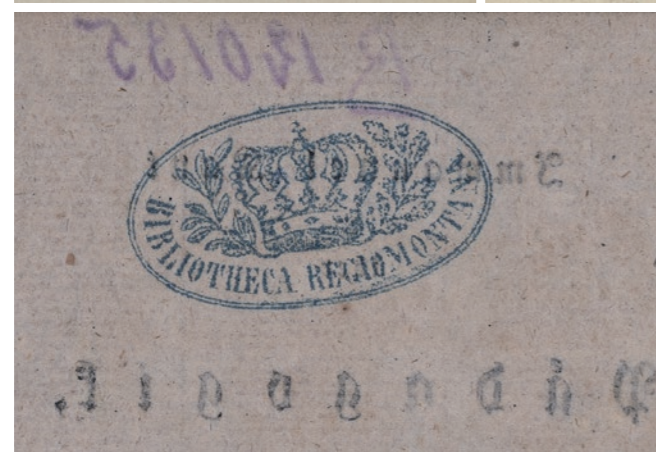
Quelques exemples d'ex-libris de l'ancienne Bibliothèque royale et universitaire de Königsberg (coll. BNU)

l'administration de la bibliothèque ait plutôt souhaité s'en défaire. Dans ce contexte, l'appel de Barack et la réaction du ministère prussien de l'Éducation ont sans doute trouvé à Königsberg un écho favorable, car la quasi-totalité des doubles de Gotthold, plusieurs milliers de volumes 11 , furent envoyés à la bibliothèque de Strasbourg au moment de sa reconstruction.