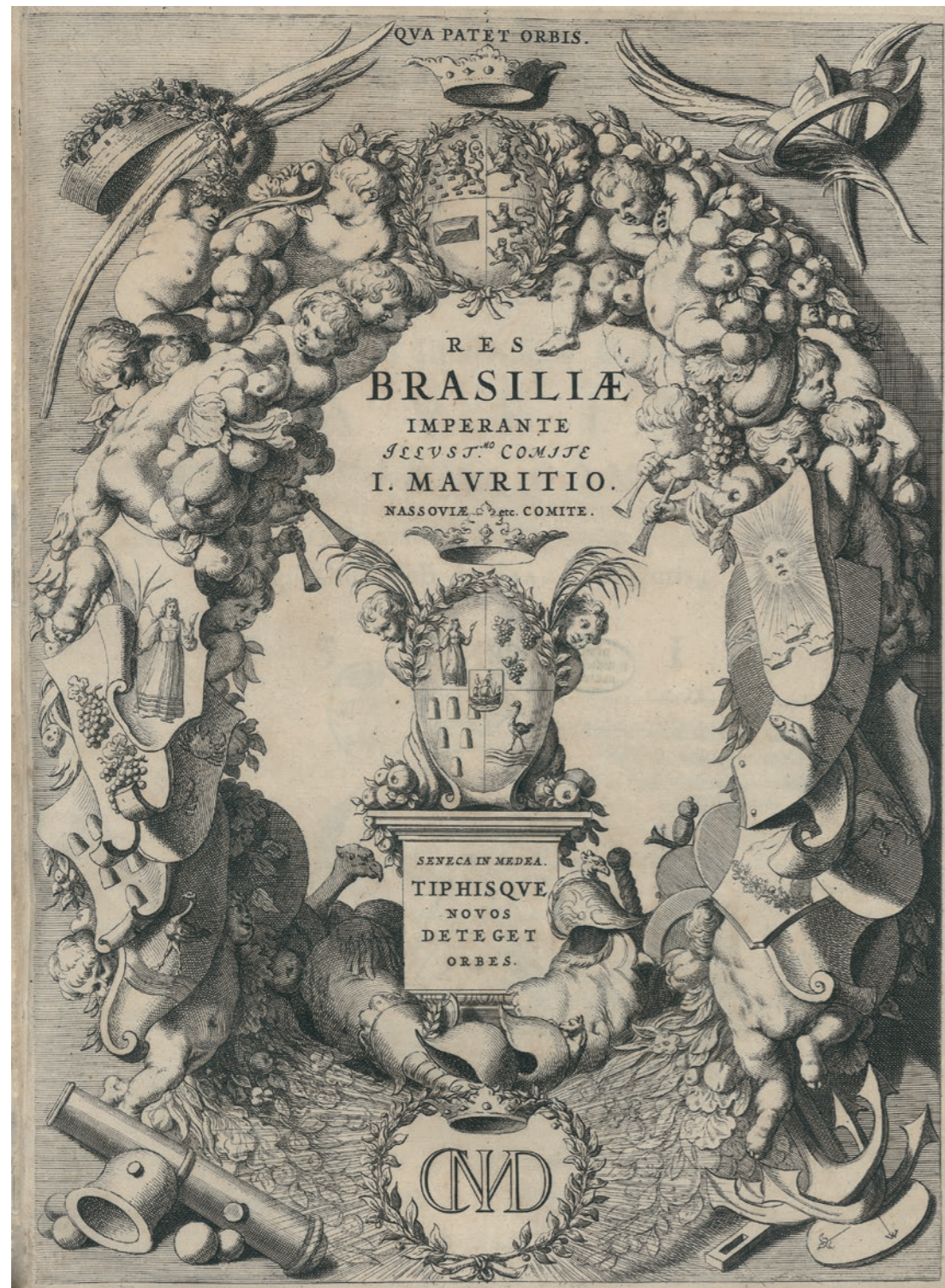
Frontispice de l'ouvrage Rerum per octennium in Brasilia et alibi nuper gestarum... historia de Caspar van Baerle (Amsterdam, Blaeu, 1647). Un commentaire manuscrit sur la page de titre précise qu'il s'agit d'une « editio rarissima ». L'ouvrage avait été offert à la Bibliothèque royale de Königsberg en 1811 (coll. BNU).