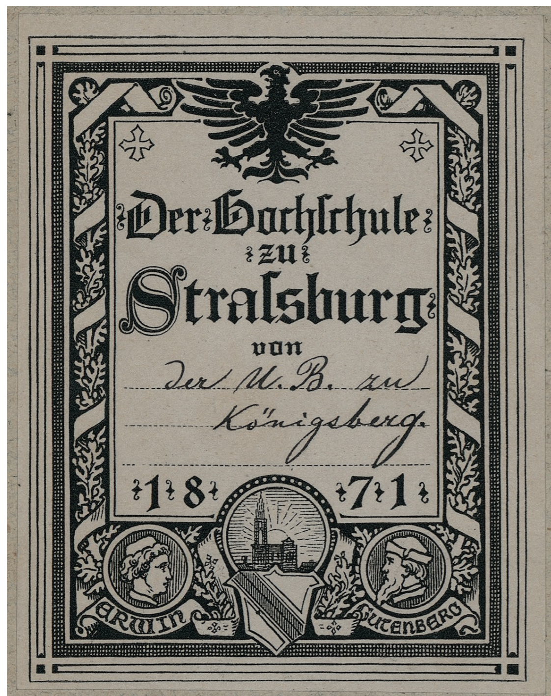
Etiquette fabriquée pour la réception des livres offerts au moment de leur arrivée à Strasbourg, sur laquelle était mentionné le nom des donateurs (coll. BNU)