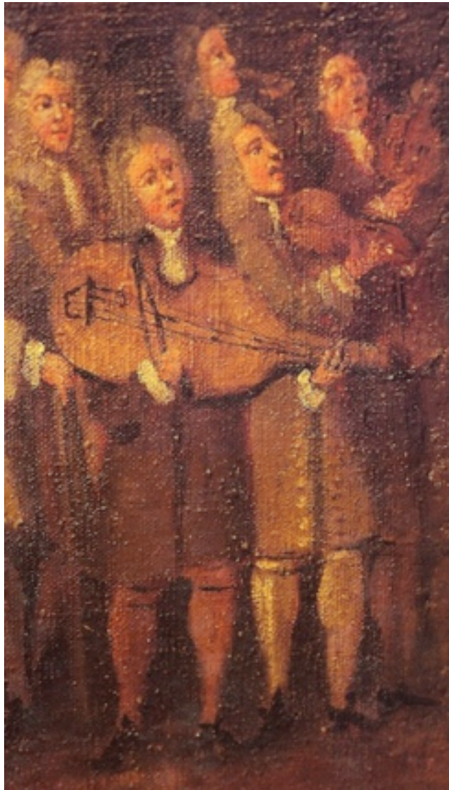
Ill. 1. Procession de la Fête-Dieu à Aix-en-Provence (c. 1710). Détail : l'une des deux bandes de ménétriers violonistes. Paravent, Huile sur bois, 2,15 x 6 m. Musée du Vieil Aix (Aix-en-Provence), inv. 867.3.1.

Capitouls en l'honneur de Madame de Cambon, épouse du premier président du parlement, 27 ménétriers jouent pour le bal, dont 19 violons (sans indications de registres), 2 tambourins et 6 basses 25 . Un document représentant les festivités de la Fête-Dieu à Aix-en-Provence en 1776 26 montre un joueur de tambour à côté duquel se tient un joueur de basse de violon. Un tel duo est totalement improbable. Il suggère simplement la présence d'une part de musiciens, peut-être d'origine militaire ou provenant de la jeunesse urbaine, représentés par ce tambour, et d'autre part d'une bande de violons, évoquée ici par ce joueur de basse. Rappelons qu'Aix-en-Provence possédait une bande municipale de violons et que deux bandes de violons ont été représentées sur l'une des faces d'un paravent figurant la procession de la Fête-Dieu de cette ville vers 1710 (cf. ill. n° 1) 27 .