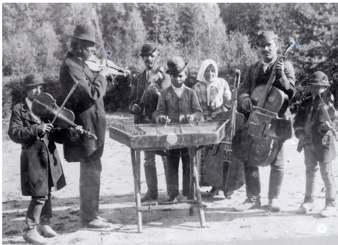
Ill. 7. Bande de musiciens tsiganes entre 1887 et 1895, Transylvanie, Hongrie. Musée d'Ethnographie de Budapest, inv. 76160. Cliché József Huszka. © Musée d'Ethnographie de Budapest.