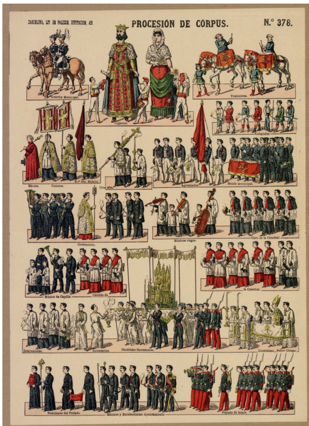
Ill. 5. Procession du Corpus. Lithographie, c. 1875, n° 378

En Catalogne, il a existé une tradition de bandes de violons jusque vers la fin du XIX e et le début du XX e siècle, essentiellement active dans le contexte processionnel religieux, notamment les processions du Corpus. Dans cette région, cette pratique a donné lieu à de nombreuses représentations iconographiques figurant non pas la procession dans son intégralité, mais les groupes et participants les plus significatifs dans une succession de petits motifs indépendants. Ces documents étaient édités isolément, comme de véritables « feuilles volantes ». Les centres d'archives catalans en conservent de nombreux exemplaires (ill. n° 5). On peut y découvrir des