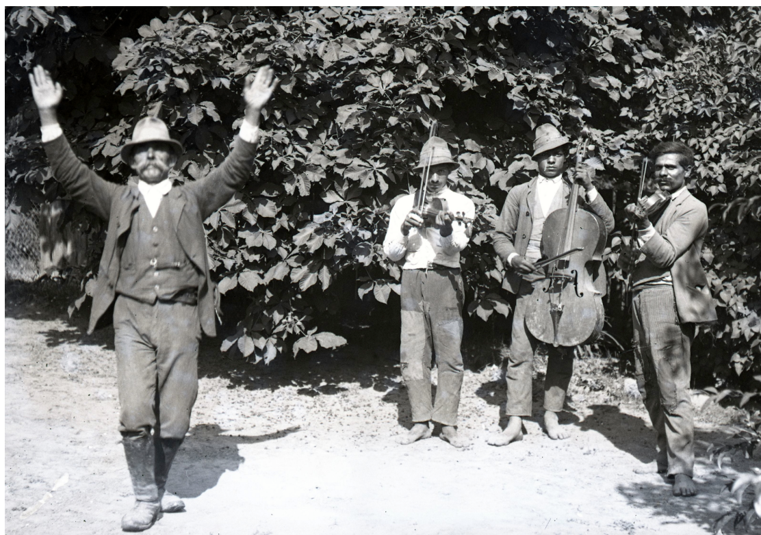
Ill. 6. Tsiganes accompagnant un danseur, Márcadópuszta, Hongrie, 1932. Musée d'Ethnographie de Budapest, inv. 66626 © Musée d'Ethnographie de Budapest. Cliché Sándor Gönyey.