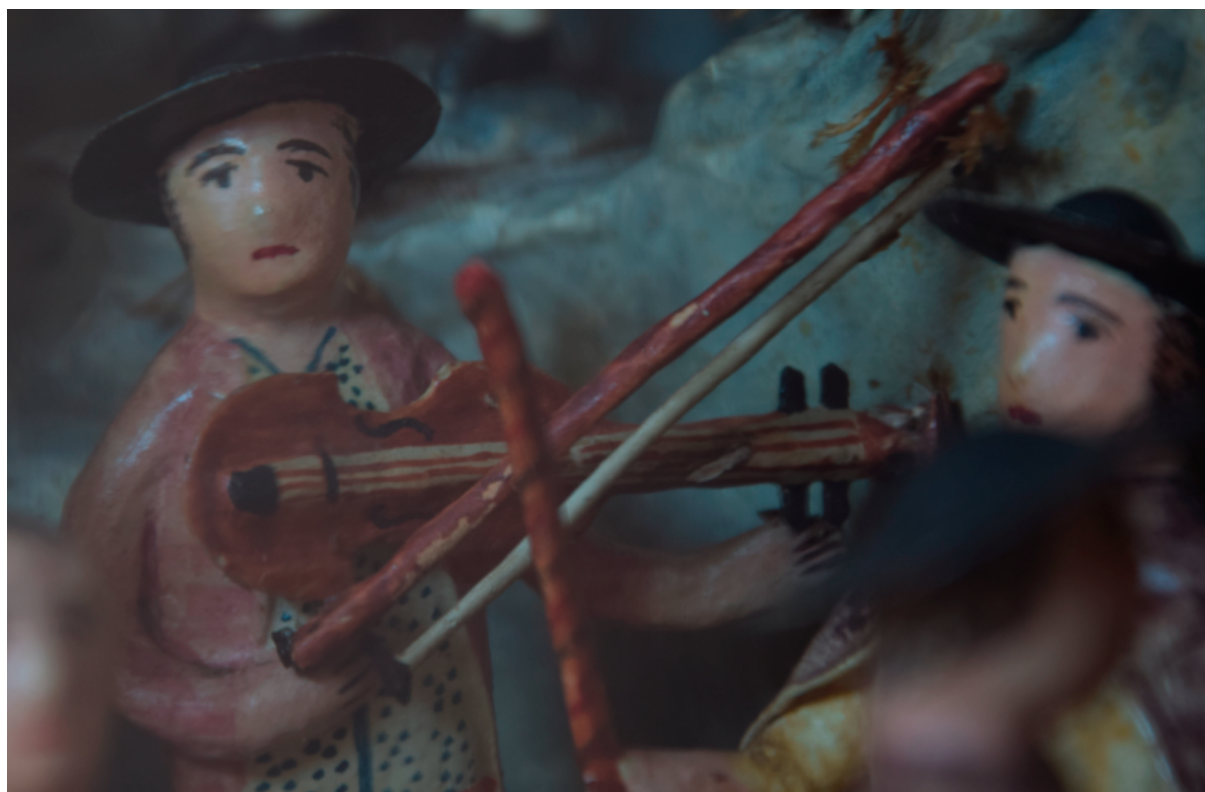
Ill. 2 et 3. Crèche, bois, papier, carton, verre, fin XVIII e siècle, et détail.

Musée d'Art et d'Histoire de Provence (Grasse, Alpes-Maritimes). inv. 2012.0.2004.