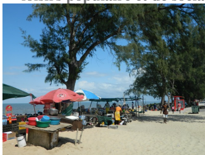
Figure 6 : Se détendre le dimanche à la plage de Costa do Sol, un lieu de loisirs populaire et de sociabilité pour tous, Maputéens comme étrangers.