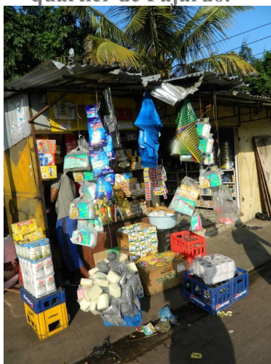
Figure 5 : La boutique de Mohamed, Guinéen, « à l'aventure » dans le quartier de Fajardo.