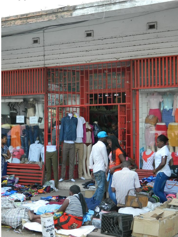
Figure 4 : Dans le quartier central de la Baixa, nombre de commerces de vêtements sont tenus par des Africains de l'Ouest, dans des boutiques appartenant à des Indo-mozambicains.