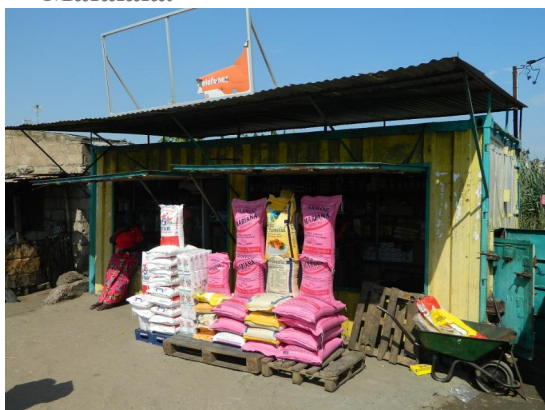
Figure 1 : La configuration emblématique du conteneur aménagé en épicerie de quartier à Maputo, tenu par une Burundaise. Quartier de Mafalala.