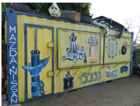
Maputo, 2017.