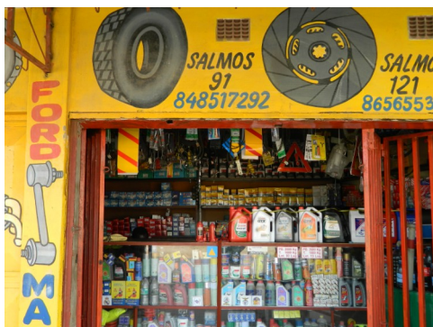
Maputo, 2017.