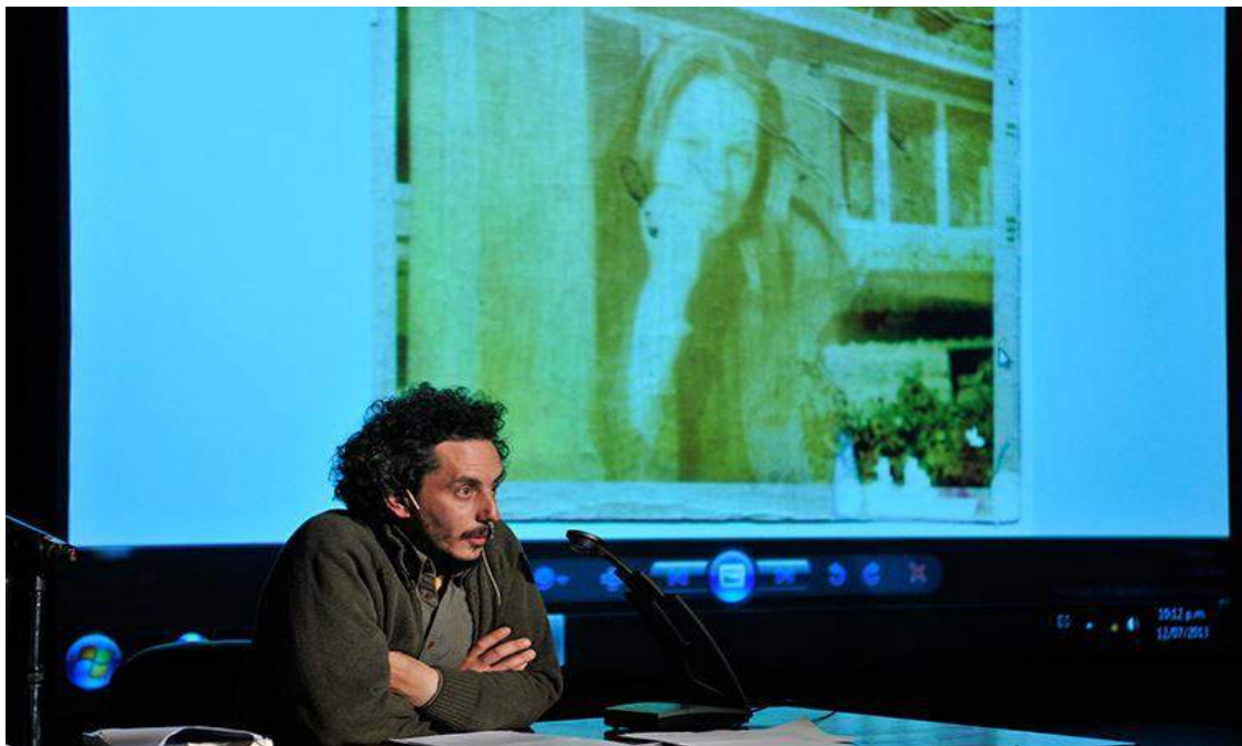
Figura 1 - Campo de Mayo (2013), de Félix Bruzzone

Uma das conferências mais reconhecidas pela crítica na segunda edição da série (2013) foi a do escritor Félix Bruzzone, que em numerosas obras trabalha com procedimentos da autobiografia e do depoimento. Dentro do ciclo curado por Arias, ele lê um texto em processo de escrita cujo personagem principal é um corredor que persegue a figura de sua mãe desaparecida na ditadura. O personagem, Fleje, cujo nome é nitidamente semelhante ao do autor, se muda