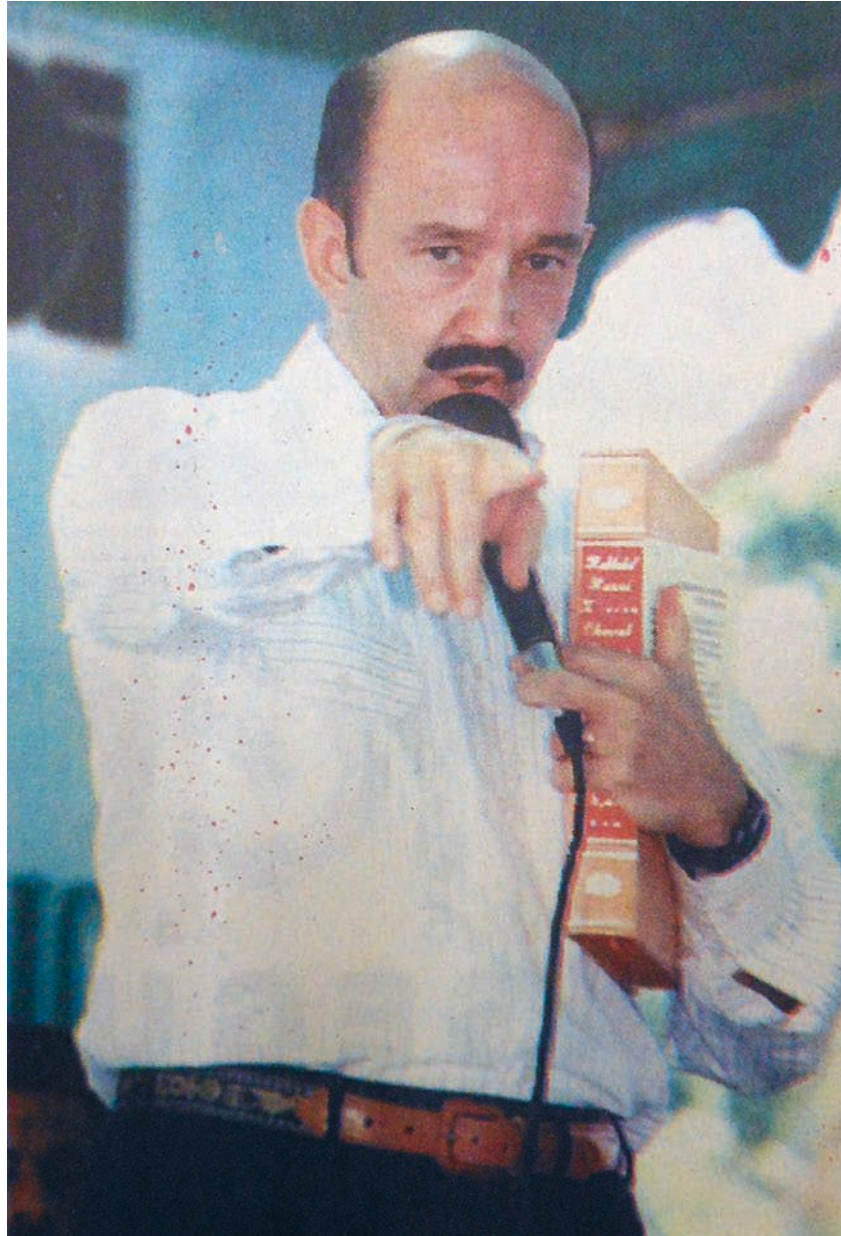
Carlos Salinas de Gortari tenant un exemplaire du «nouveau livre sacré» de Xocén. Photographie prise à Mérida par Arturo Flota. Novedades , 17 mai 1994.