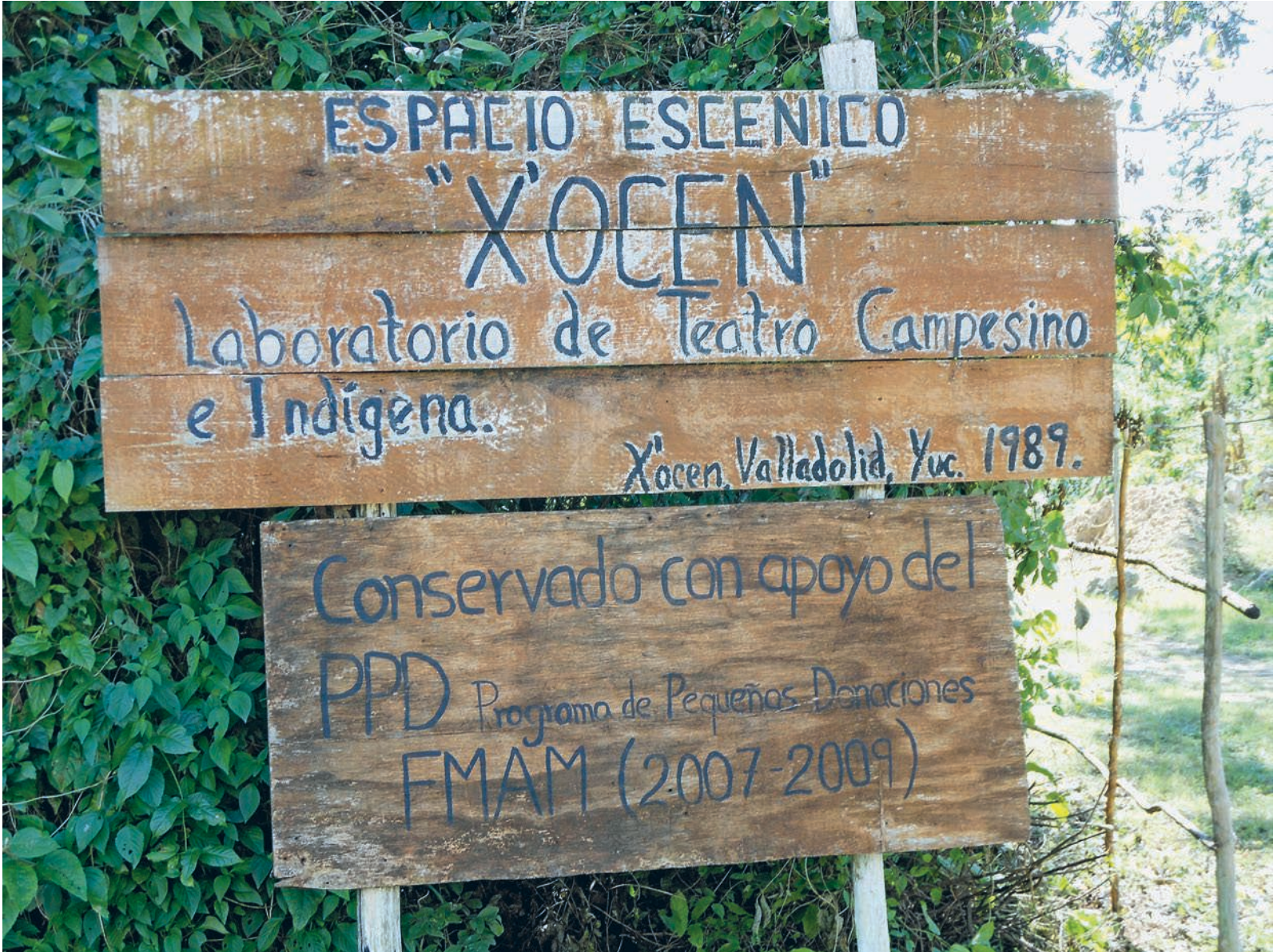
Écriteau à l'entrée du Laboratoire théâtral de Xocén. Photographie de Pierre Déléage, 2012.