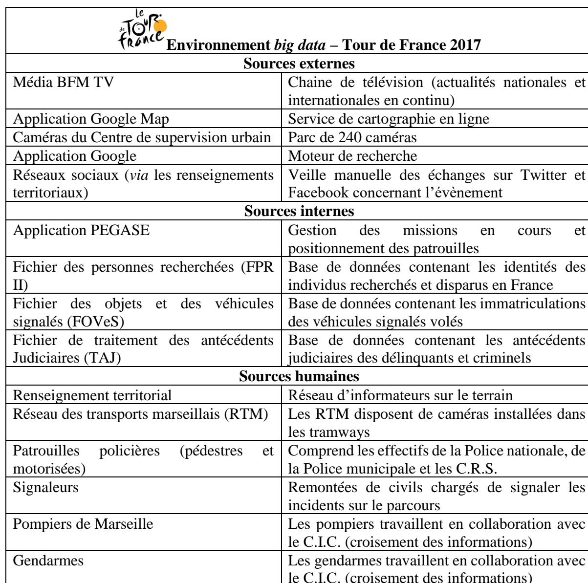
Tableau 1 Environnement big data du superviseur

Lors d'un évènement tel que le passage du T.F. 2017 en épreuve de contre-la-montre, le superviseur bénéficie d'un environnement informationnel très riche et varié. Celui-ci est présenté dans le Tableau 1.