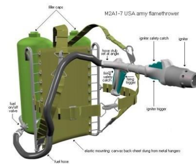
Figure 2. Le lance-flammes M2A1-7 de l'armée états-unienne.

Un exemple de lance-flammes moderne est donné par la figure 2.