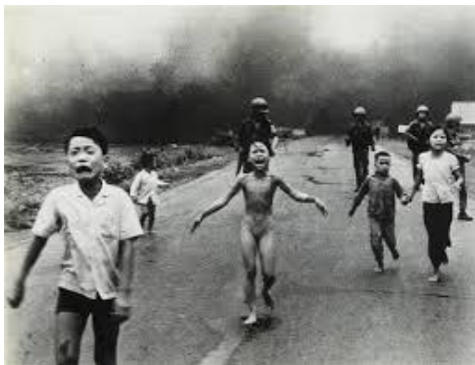
Figure 4. Les brûlures de la "petite fille au napalm" soignées 40 ans après. La photo de cette petite-fille brûlée après une attaque américaine au napalm pendant la guerre du Vietnam le 8 juin 1972 a fait le tour du monde. Plus de 40 ans après, Kim Phuc va enfin recevoir un traitement au laser pour soigner ses cicatrices. Artist: Nick Ut (Vietnamese, born 1951) Pulitzer Prize-winning photograph of children fleeing a napalm strike, South Vietnam, 1973. (source: google 11 )

Dans l'armement le napalm 10 , inventé en 1942, est de l'essence gélifiée, habituellement utilisée dans les bombes incendiaires. Sa formule est faite pour brûler à une température précise et coller aux objets et aux personnes (Figures 4 et 5). En 1980, son usage contre les populations civiles a été interdit par une convention des Nations unies ainsi que par le Droit international humanitaire, prenant sa source dans les Conventions de Genève, qui proscrirent toutes armes ne faisant pas la distinction entre les civils et les combattants.