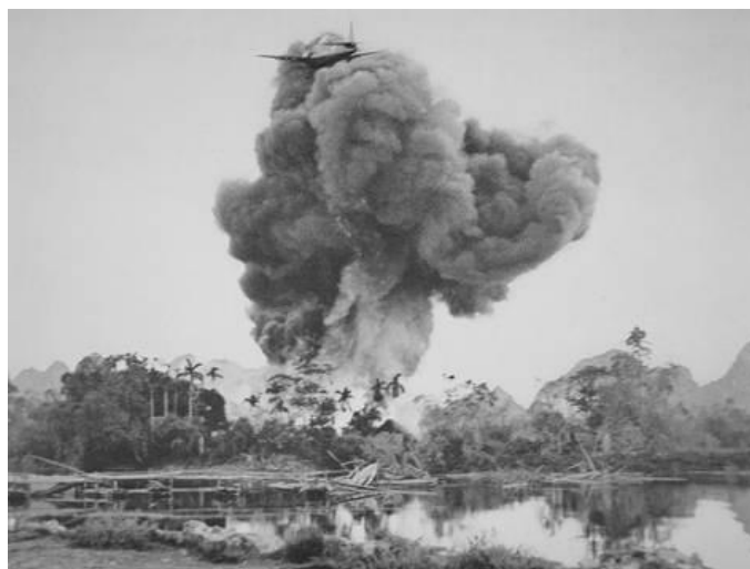
Figure 5. Bombardement français au napalm sur Phu Nho Quan, pendant la guerre d'Indochine en 1954.