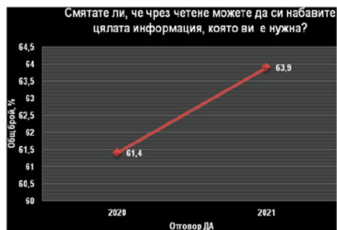
Фиг. 1. Достатъчност на четенето като форма на оперативно информиране (2020 г. и 2021 г.)

Първата фаза беше в самото начало на извънредно положение в България заради пандемията от COVID-19 и допитването се проведе в периода 18 – 25 март 2020 г. Втората фаза беше точно след една година живот в условията на извънредна епидемична обстановка в България заради пандемията от COVID-19 и допитването се проведе в периода 17 – 24 март 2021 г. Отговорите бяха осигурени чрез онлайн проучване с помощта на платформата Google Forms 9 . Онлайн проучването можеше да бъде попълнено от персонален компютър, лаптоп, таблети или смартфон. Въпросникът съдържаше осем затворени въпроси с еднозначен отговор, а попълването му отнемаше около 5 минути. Общият брой на респондентите е 628. В първата фаза на проучването (18 – 25 март 2020 г.) се включиха 251 респонденти, а с втората фаза (17 – 24 март 2021 г.) бяха обхванати още 377 български граждани.