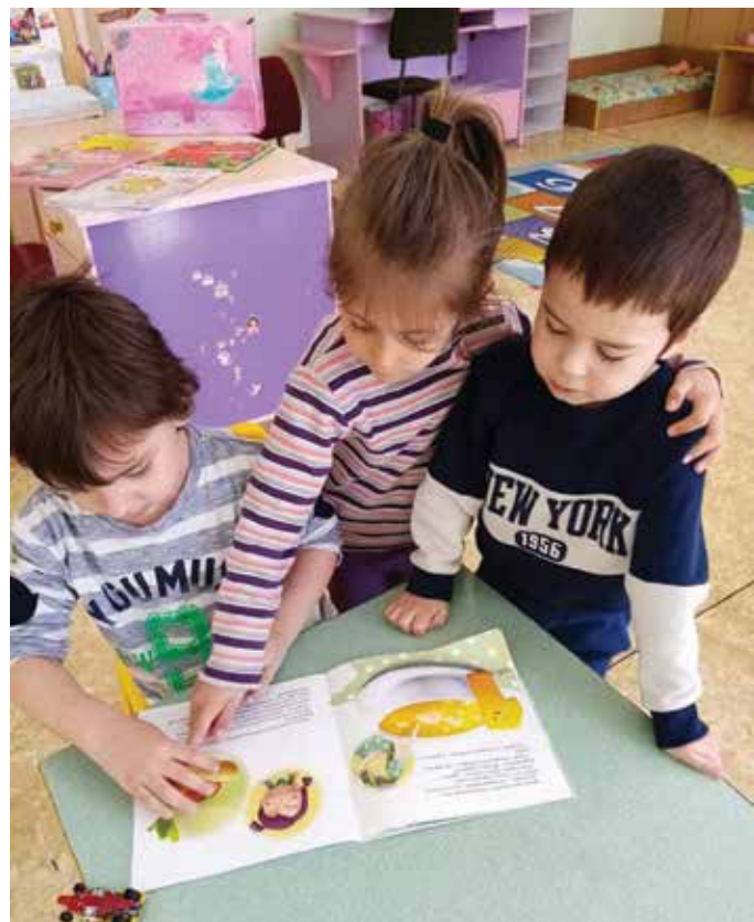
Пътуваща кутия с детски книги в детска градина в Силистра

Регионални, градски, общински, читалищни и училищни библиотеки приканиха своите читатели да се включат в маратона със свои видео клипове с четене на стихотворения, гатанки, приказки, разкази, откъси и цитати от книги; на снимки, свързани с четенето, писането и рисуването; на рисунки по художествени произведения или на любими литературни герои. Като резултат в периода 2 – 23 април 2021 г. във Facebook профилите и YouTube каналите на библиотеките бяха споделени хиляди снимки и клипове с четящи деца, родители, доброволци, учители, читалищни секретари, самодейци, местни поети и писатели, актьори, журналисти, съдии, общественици и известни личности от цяла България и чужбина.