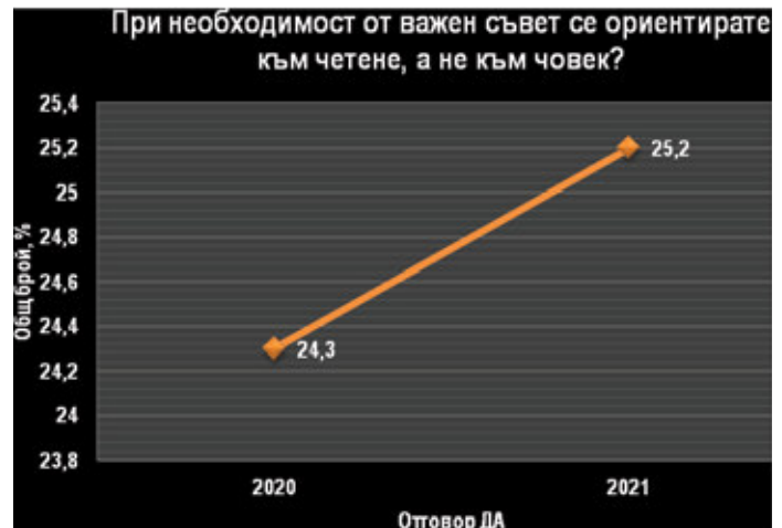
Фиг. 4. Приоритет на социалния контакт пред четенето при нужда от важен съвет (2020 г. и 2021 г.)

Установихме и индикатор за конкуренция между социалните контакти и асоциалната дейност на четенето по време на пандемията. Общата картина показва, че твърде малка част от респондентите са склонни да жертват общуването с приятели заради четенето, макар че тенденцията сред тях в продължение на една година и тук бележи лек растеж – от 29,5% през март 2020 г. на 32,3% през март 2021 г.