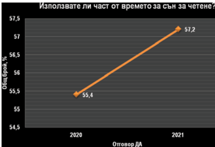
Фиг. 2. Съкратено време за сън за сметка на четенето (2020 г. и 2021 г.)

Първият и очакван резултат, който получихме чрез проучването, е за осъзната ценност на четенето като технология на информирането. Повече от половината респонденти разчитат на четенето за оперативна информация. Тенденцията бележи лек ръст – от 61,4% през март 2020 г. до 63,9% през март 2021 г.