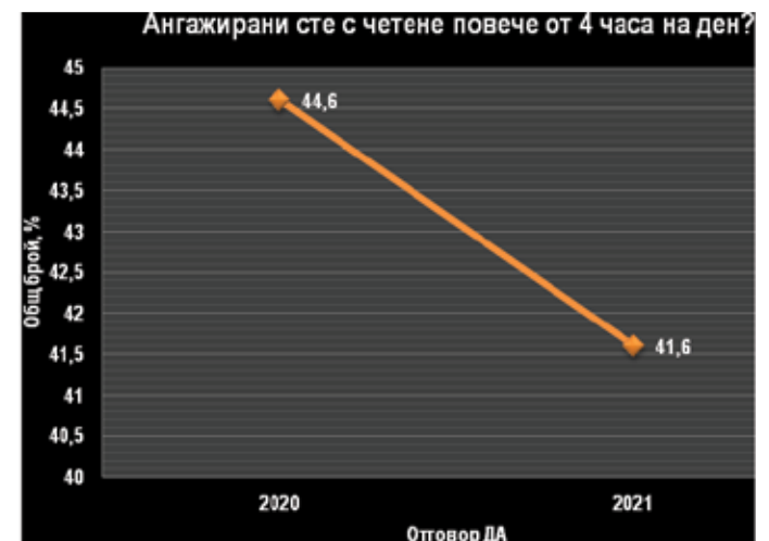
Фиг. 5. Отделено време за четене над 4 часа дневно (2020 г. и 2021 г.)

Конкуренцията между социалния контакт с жив човек и асоциалната дейност на четенето в едногодишния период от пандемията е най-отчетлива при въпроса „При необходимост от важен съвет се ориентирате към четене, а не към човек?“. Когато става дума не за оперативно информиране, а за практическо знание (съвет) само ¼ от респондентите разчитат на четенето (от 24,3% през март 2020 г. на 25,2% през март 2021 г.). Макар за една година тази група да е нараснала с около 1%, мнозинството българи продължават да не приемат четенето за надежден канал за съвети по важни въпроси при пандемията.