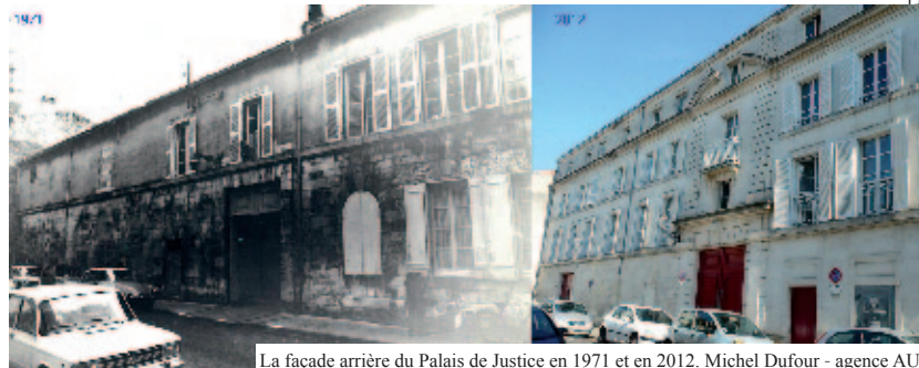
La façade arrière du Palais de Justice en 1971 et en 2012.

5 Les façades ont été très souvent "banalisées" par les alignements du XIX e ou XX e siècle ou encore par la "sécheresse" de certains ravalements modernes.