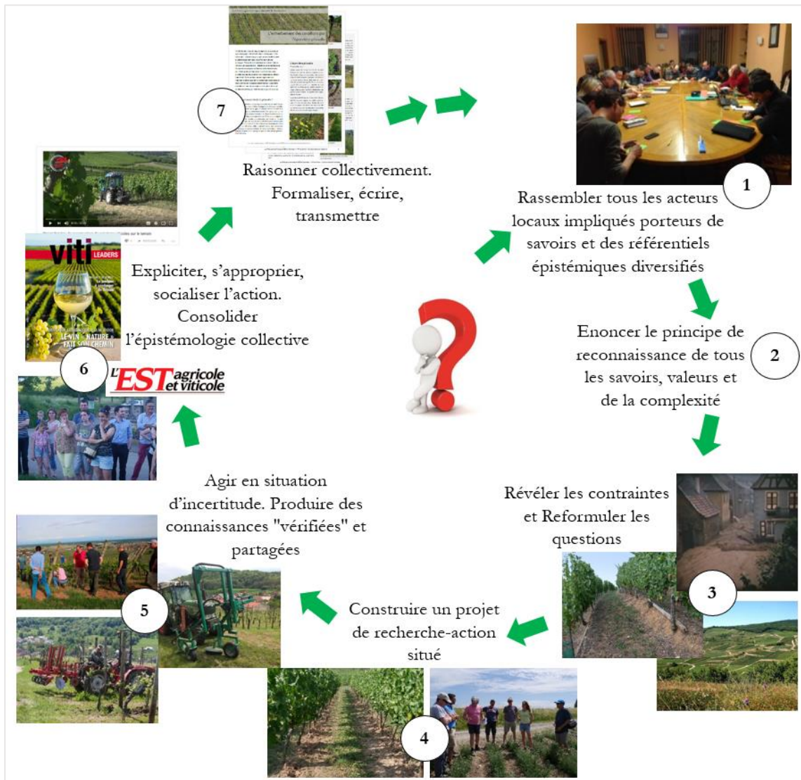
Figure 1 : Représentation des étapes successives d'un projet de recherche action participative conduit selon la méthode REPERE. La fin d'un cycle suscite de nouvelles questions qui feront l'objet d'un nouveau cycle, ce qui confère à ce schéma la forme d'un argonaute.

L'élaboration commune de ces énoncés a remis en cause les points de vue et les raisonnements des acteurs. Par exemple, lors de l'élaboration collective du consensus autour de l'influence des pratiques viticoles sur la santé de la vigne, différentes hypothèses explicatives ont été proposées par chaque acteur, en lien avec ses connaissances et son point de vue sur la vigne. Cet atelier a permis d'identifier des manques de connaissances, et soulevé alors de nouvelles questions , avec un consensus collectif sur celles-ci. Cette dynamique est caractéristique du processus en argonaute de la recherche action participative REPERE présenté en Figure 1. Ainsi, la formulation de nouvelles interrogations par les acteurs est un résultat à part entière de la recherche (Masson et al. 2021).