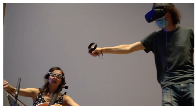
Figure 3. INScore embarqué sur des lunettes EPSON bt-350 (à gauche), dans la pièce ‘Fantaisie, Querying Schumann’s op.73’ (J. Bell, 2021)

Cela s’est avéré pratique à des fins de débogage, et a révélé un affichage confortable pour l’utilisateur. La version native Android de INScore a obtenu des résultats stables. L’inconvénient des lunettes EPSON bt-350, pour les tests basés sur un navigateur, est qu’elles ne parviennent pas actuellement à charger les pages html servies par DRAWSOCKET, INScoreWeb ou SmartVox.