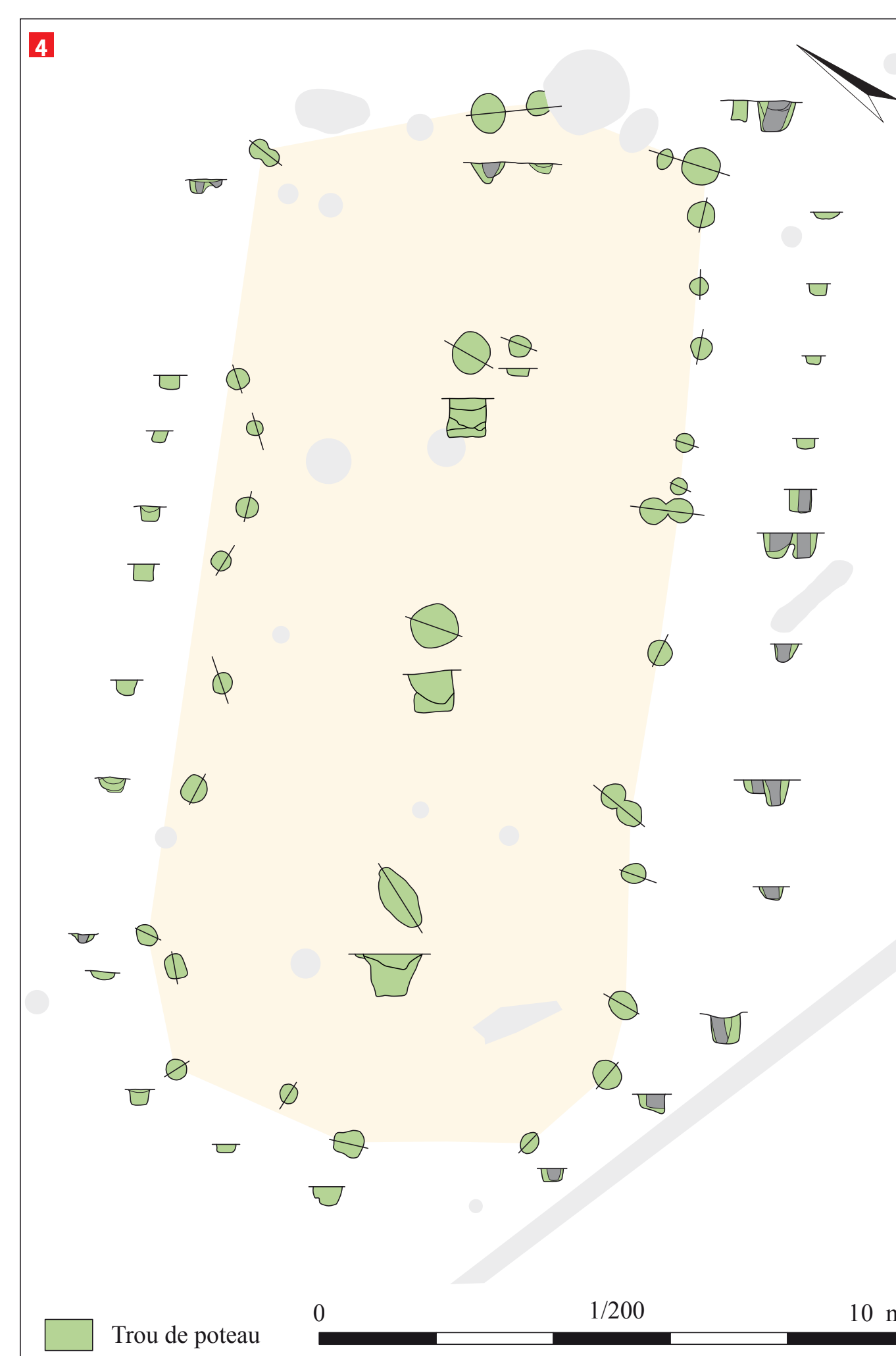
4 Bâtiment L Plan et profils des trous de poteau du bâtiment L du milieu du X e s. © S. Joly d'après Couvin dir 2013.