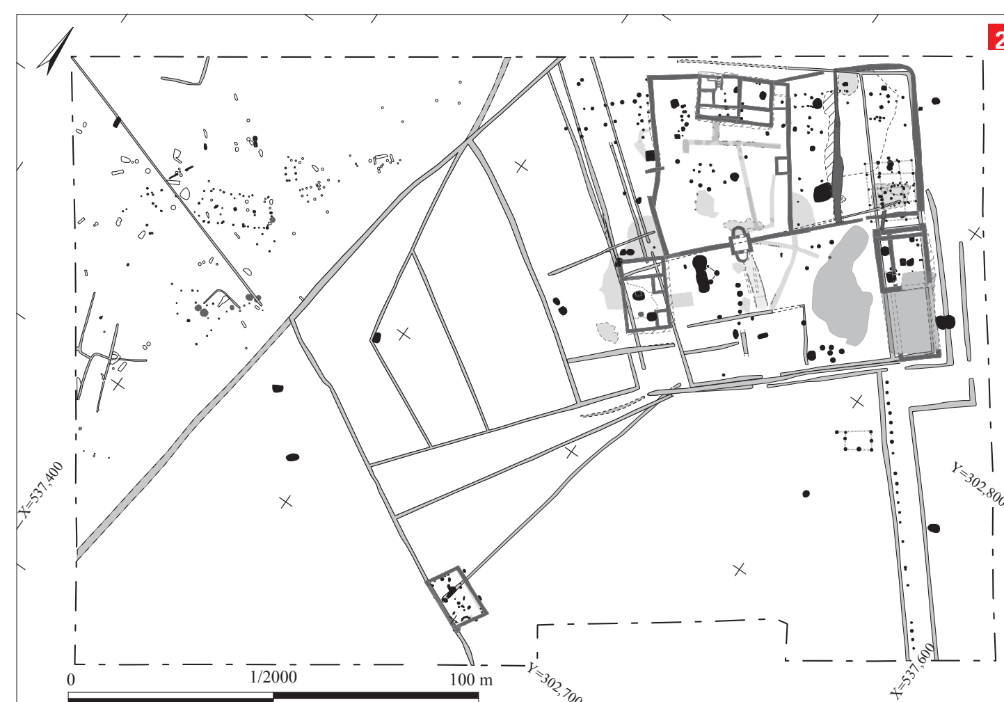
2 Plan général Plan général du site de Beaudisson à Mer. © S. Joly d'après Couvin dir 2013.