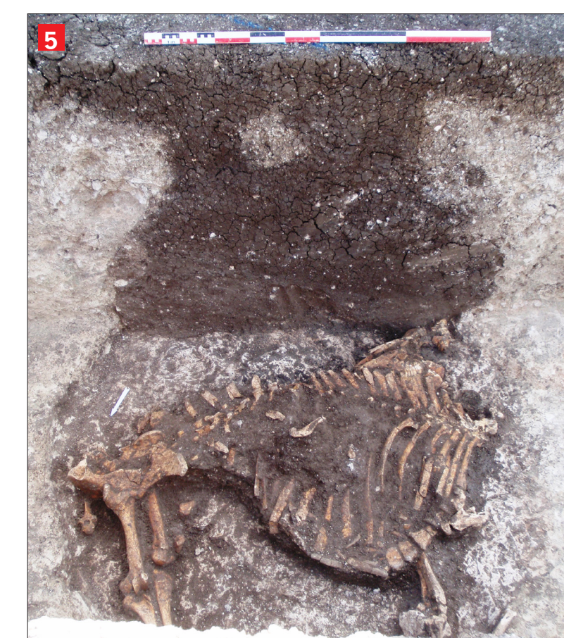
5 Carcasse de bovin Une carcasse de bovin mâle adulte (7-8 ans) en cours de dégagement au fond du silo F.1303 du milieu du X e s.