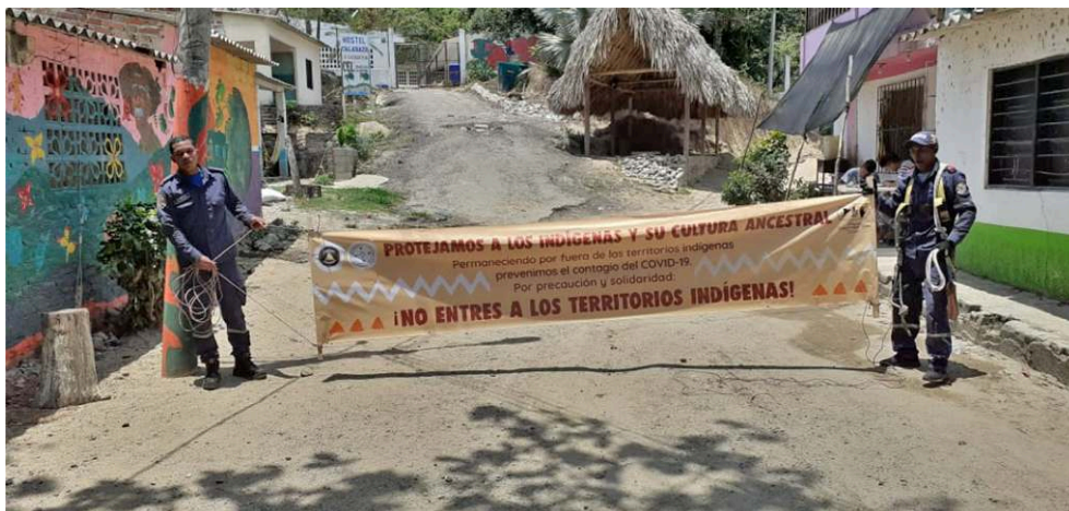
Illustration 1 : Membres du peuple huitoto en Colombie

frontières par un contrôle des points d'accès afin de se placer en confinement communautaire (Carr, 2020) (illustration 1).