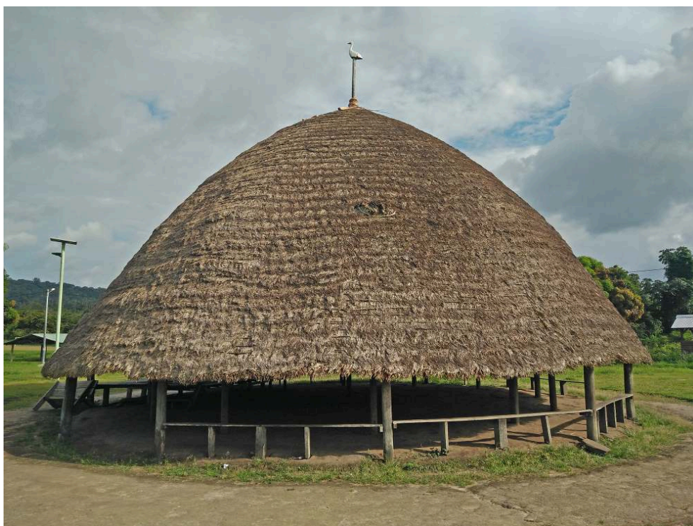
Illustration 3 : Tukupipan du village wayana de Taluen pouvant accueillir des visiteurs