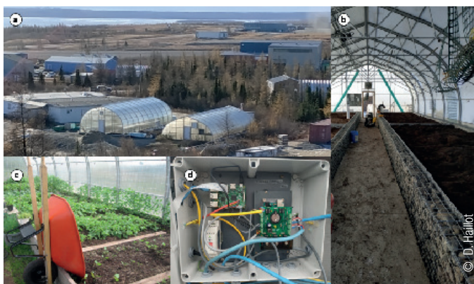
Serres de Kuujuaq (a), pour lesquelles un système de stockage innovant a été mis en place (b) afin d'allonger la saison de culture (c). Un suivi des performances du système est permis grâce à une instrumentation spécifique développée dans le cadre du projet (d)